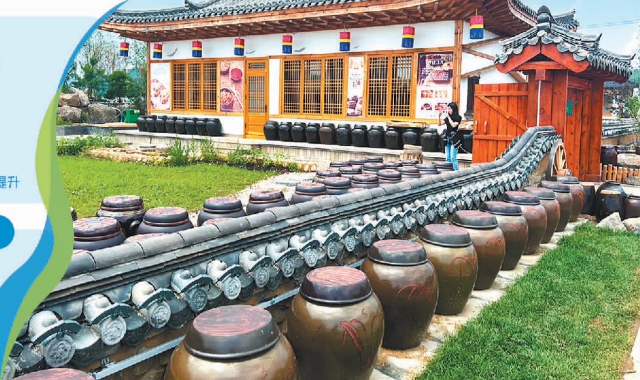
吉林省延边州敦化市红石乡中成村是一个朝鲜族村落，一名游客正在当地一处民族特色小院里赏景拍照。

道，并把园区建设得古色古香。据介绍，该产业园项目全部达产后，可解决当地2000人就业，带动当地农民的农副产品在原有收入基础上增收20亿元，同时促进汪清县物流业、旅游业发展。