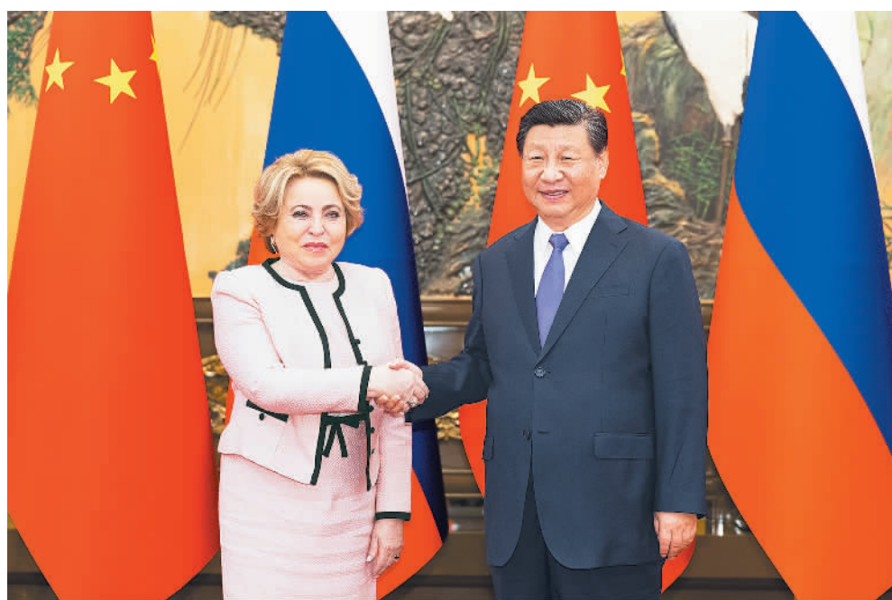
7月10日下午,国家主席习近平在北京人民大会堂会见俄罗斯联邦委员会主席马特维延科。

会见后,双方发表《中华人民共和国和所罗门群岛关于建立新时代相互尊重、共同发展的全面战略伙伴关系的联合声明》。王毅、王小洪参加会见。