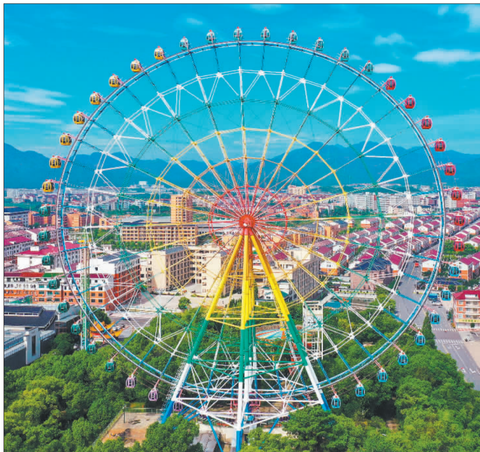
▼6月28日,浙江省东阳市南马镇花园村,一幅宜居宜业宜游的乡村美景。东阳市深入推进“千万工程”,持续推进美丽乡村建设。