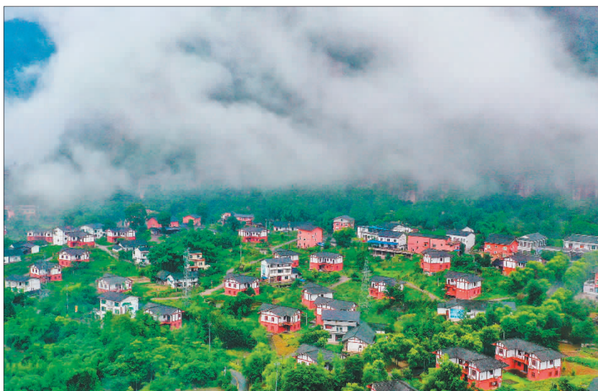
▶6月29日,贵州省赤水市复兴镇凯旋村,错落有致的民居笼罩在晨雾中。近年来,赤水市复兴镇以党建为引领,充分利用自然生态资源优势,大力发展乡村旅游,助民增收。