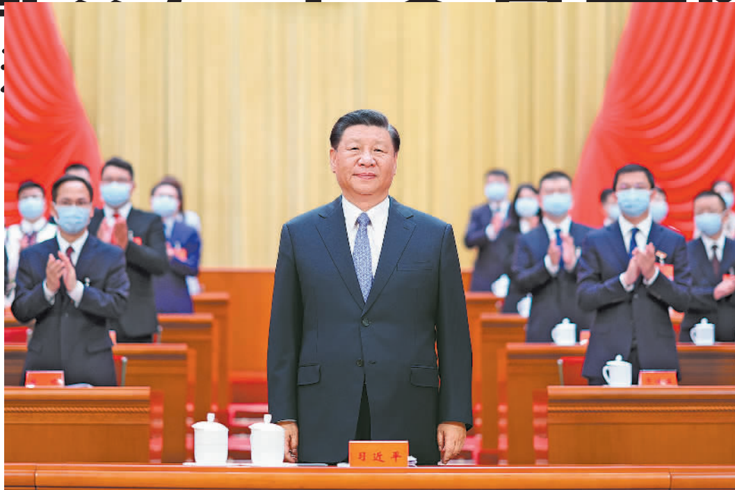
6月19日,中国共产党第十九次全国代表大会在北京人民大会堂开幕。这是中共中央总书记、国家主席、中央军委主席习近平在主席台向与会代表致意。