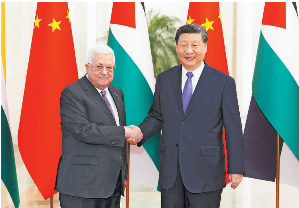
这是会谈前，国家主席习近平在北京人民大会堂同来华进行国事访问的巴勒斯坦总统阿巴斯举行会谈。