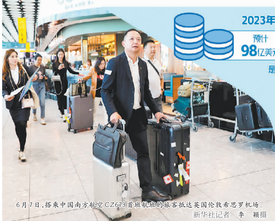
6月7日，搭乘中国南方航空CZ673首班航班的旅客抵达英国伦敦希思罗机场。