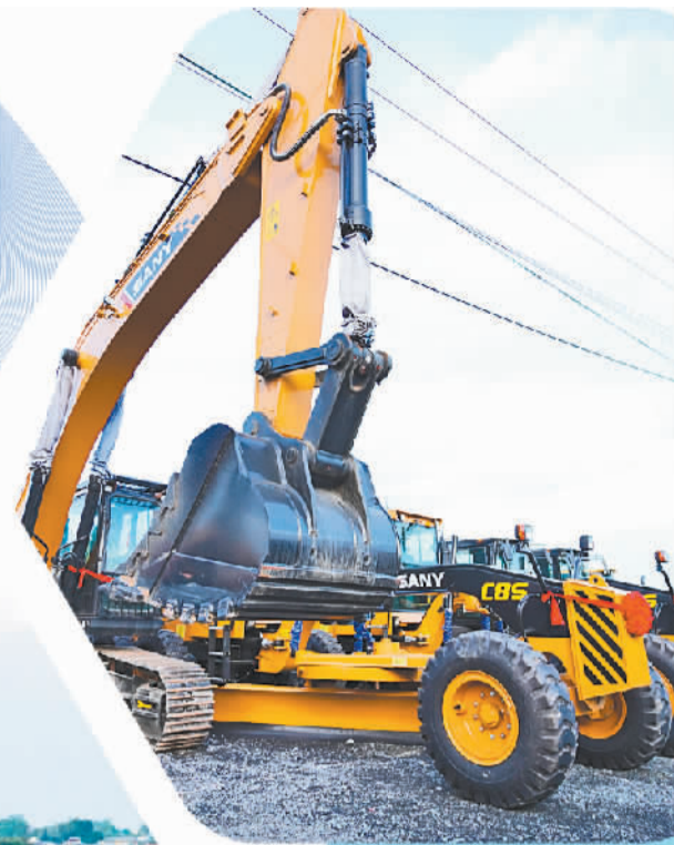
这是6月6日在柬埔寨千丹省拍摄的高速公路施工设备。

在美联储持续加息、全球金融环境收紧、经济衰退风险上升的背景下，亚洲经济体展现出较强的发展韧性，内生动力持续增强。亚洲经济发展内生动力的持续增强，既表现在亚洲主要经济体对区域经济增长的支撑作用增强，也表现在亚洲各经济体经济发展的协同效应日益显现。总的来看，亚洲仍是世界经济增长的“火车头”。