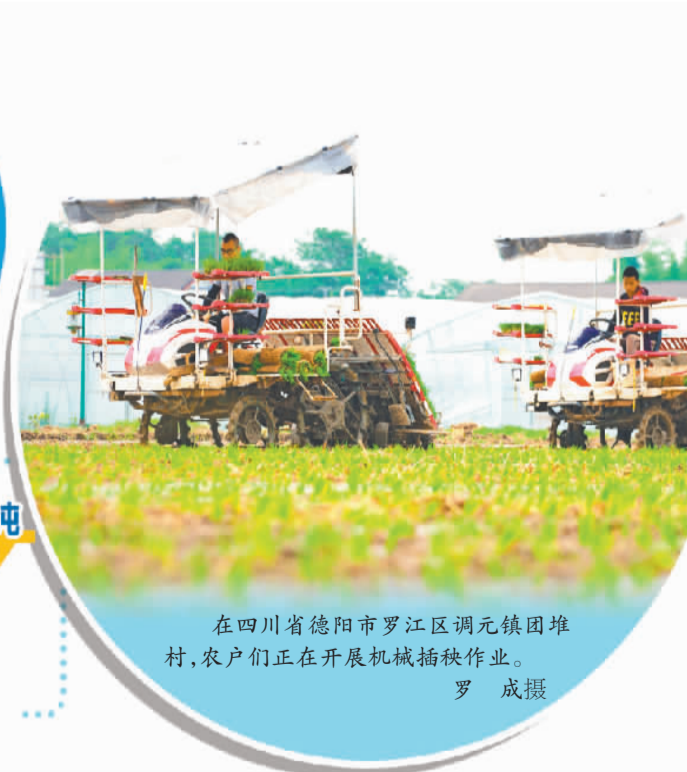
在四川省德阳市罗江区调元镇团堆村,农户们正在开展机械插秧作业。

“四川小麦规模化绿色高效生产大邑示范区今年共种植小麦10万亩,收成4000多万公斤,亩均增产20余公斤。”四川省成都市大邑县农业农村局农业技术推广科负责人徐文忠说,“我们选种的小麦品种具有抗倒、抗病、高产等特点。今年,小麦灌浆时间延长,粒重不低,产量实现了稳中有升。”