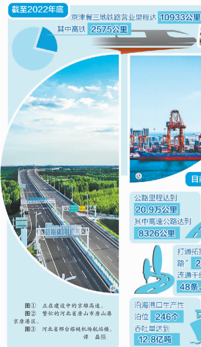
图① 正在建设中的京雄高速。 图② 繁忙的河北省唐山市唐山港京唐港区。 图③ 河北省邢台塔子沟机场航站楼。

自京津冀协同发展上升为国家战略以来,交通成为协同发展的先行领域。打通“大动脉”,畅通“微循环”,可为京津冀协同发展提供坚实基础和保障。当前,“轨道上的京津冀”主骨架基本成形,互联互通的公路网络全面构筑;京津雄核心区半小时通达,京津冀主要城市1小时至1.5小时交通圈加速形成,多节点、网格状、全覆盖的综合交通网络基本形成;通勤人员乘坐定制快巴从河北燕郊出发,1小时到达北京国贸;快递从河北发往京津,最快当天送达。交通一体化成果丰硕,正持续向纵深发展。