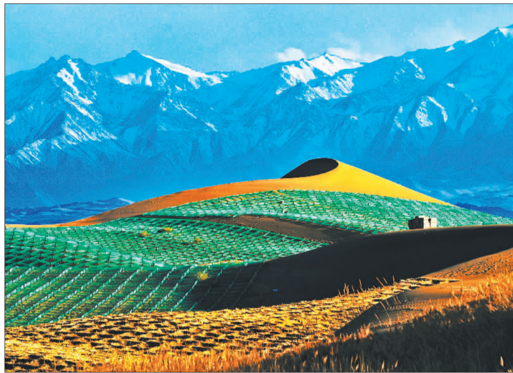
誓挡“黄龙”绿富同兴(组图之一)