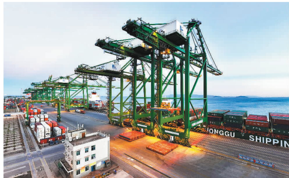
5月29日,福建省福清市江阴港区码头作业区内一派繁忙。据了解,福州江阴港区目前运营9条RCEP航线、8条“丝路海运”航线。今年1月至4月,港区集装箱吞吐量82.3万标箱,货物吞吐量1126.6万吨。

专家建议,购买房屋后应及时办理房屋权属登记,避免卖家再次出售房屋给自己造成损失。对于明显低于市场价格的房屋,买房者应谨慎购买,认真审查房屋产权登记情况。