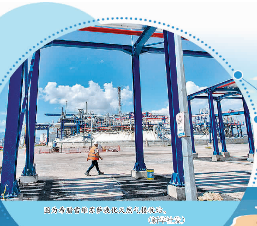
图为希腊雷维萨萨液化天然气接收站。

当地时间5月21日,希腊大选结果显示,新民主党以40.79%的得票率取得压倒性胜利,领先排名第二位的激进左翼联盟党20个百分点,成为自1974年以来排名前两位政党得票率差距最大的一次。由于采用了简单比例代表制的选举规则,未有单一政党获得议会过半议席,各政党领袖均已放弃组阁尝试,希腊料将于6月底或7月初进行第二次大选。