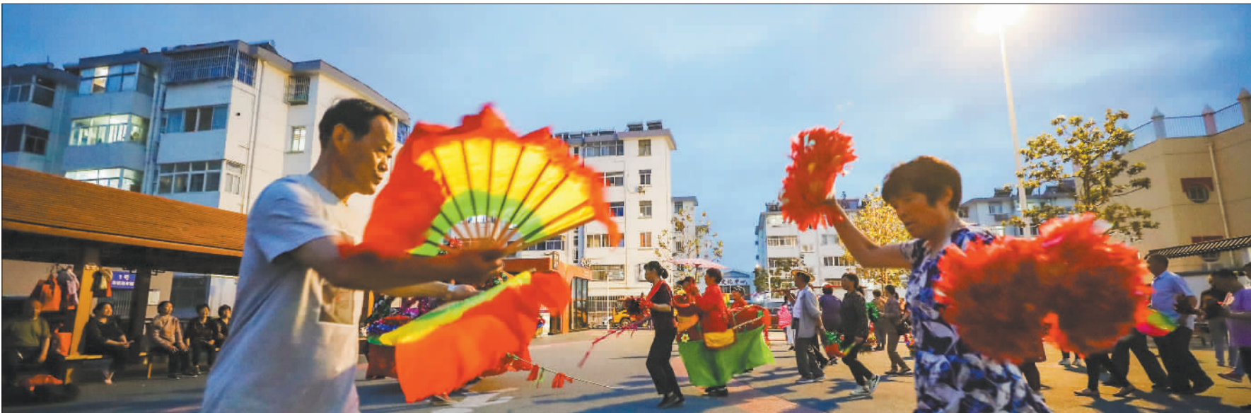
▼5月17日,江苏省淮安市清江浦区前进小区居民在广场上跳舞。该小区通过改造绿化荒置空间等措施,解决了居民无休闲娱乐场所等问题。