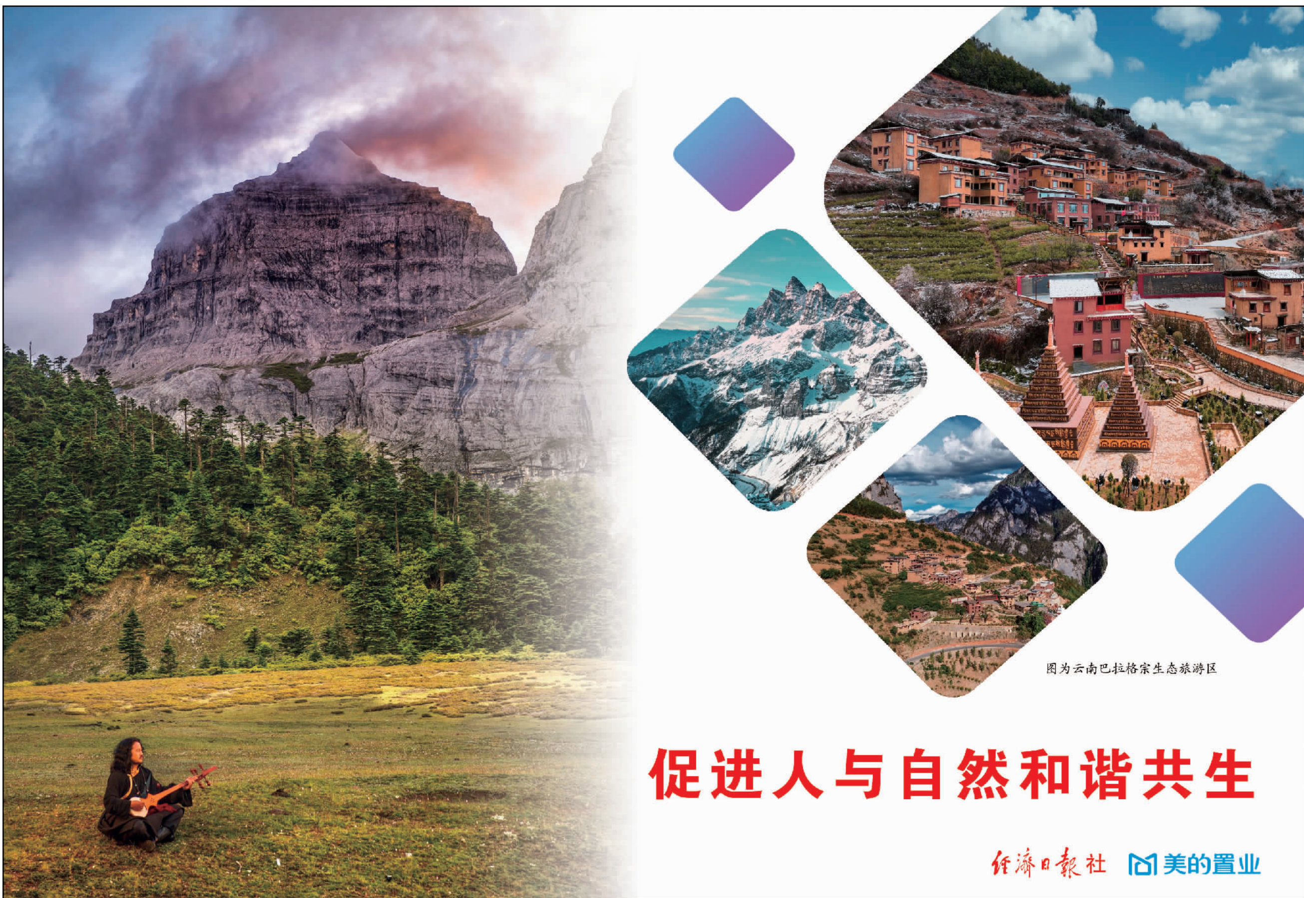
图为云南巴拉格宗生态旅游度假区