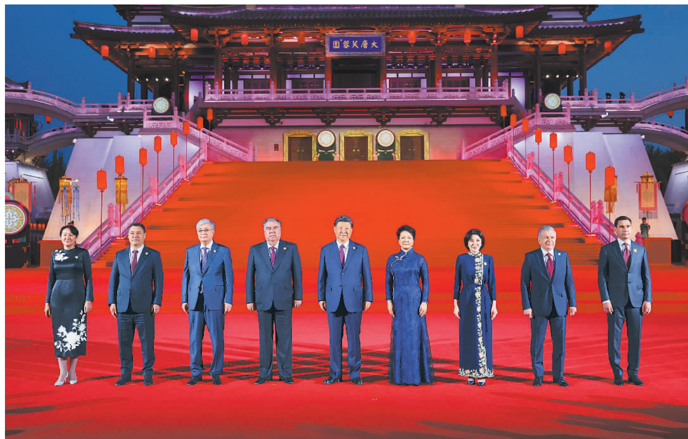
5月18日晚,国家主席习近平和夫人彭丽媛在陕西省西安市大唐芙蓉园为出席中国—中亚峰会的中亚国家元首夫妇举行欢迎仪式和欢迎宴会。宴会后,习近平夫妇同贵宾们共同观看中国同中亚国家人民文化艺术年暨中国—中亚青年艺术节开幕式演出。这是习近平发表欢迎致辞,代表中国政府和中国人民热烈欢迎中亚各国元首。