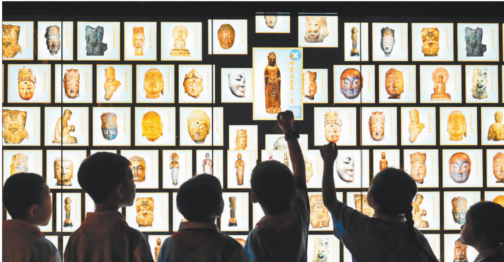
◀5月18日,小学生在河北省邯郸市峰峰博物馆参观。目前我国博物馆总数达6565家,去年举办线下展览3.4万场,接待观众5.78亿人次。