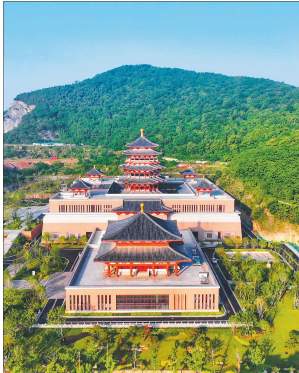
▼5月17日,湖北省襄阳市博物馆新馆。项目外部已全部完工,建成后将成为展示襄阳文化的新窗口、古城文化旅游的新地标。