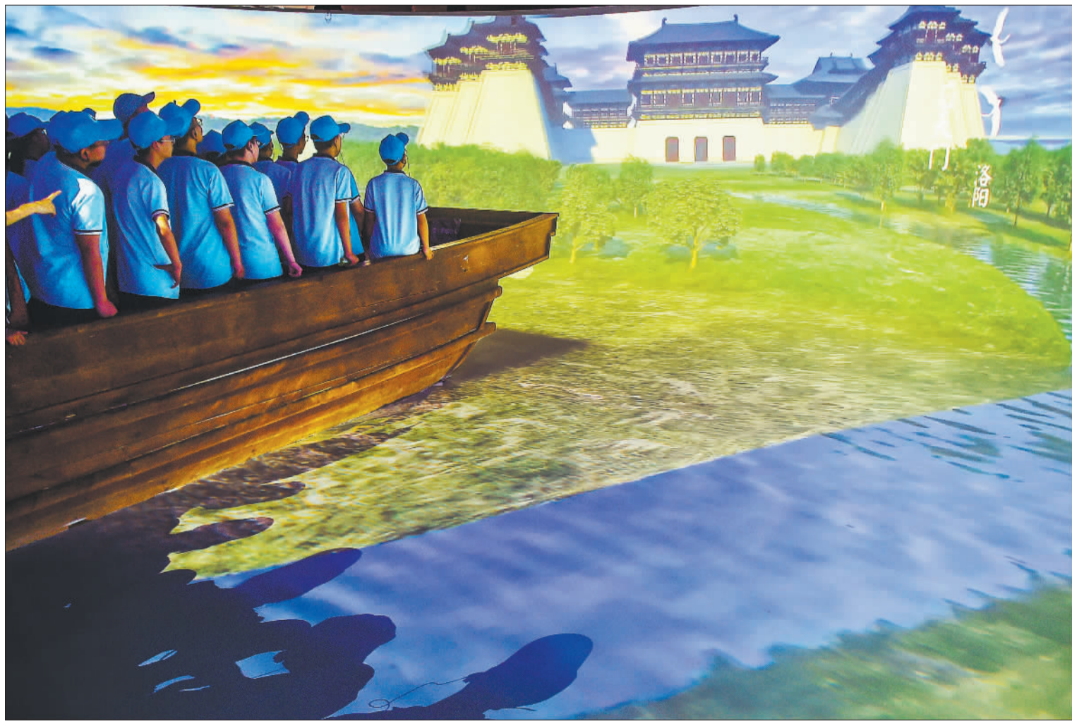
◀5月18日,位于河南省洛阳市的隋唐大运河文化博物馆,观众通过沉浸式多媒体互动和场景体验,感受隋唐大运河的历史。