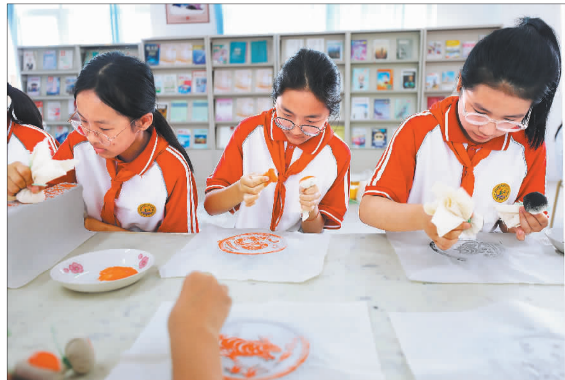
▼5月18日,山东省沂南县青驼镇初级中学学生在县博物馆工作人员指导下学习拓拓技术,沂南县博物馆举办“流动博物馆进校园”活动,让学生了解当地历史文化。

本版编辑 李景录 翟天雪 来稿邮箱 jjrbsyb58392306@163.com