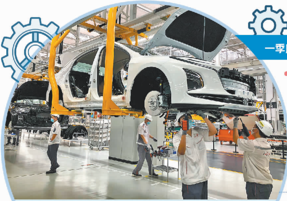
一汽集团红旗繁荣工厂生产线,工人们在工作台操作。

近年来,吉林省将冰雪和避暑休闲旅游作为全省3个万亿级大产业之一予以重点打造。3月份,吉林省春季旅游项目集中开工活动举行,开工旅游项目72个,总投资1083亿元。“今年,吉林省计划建设旅游项目