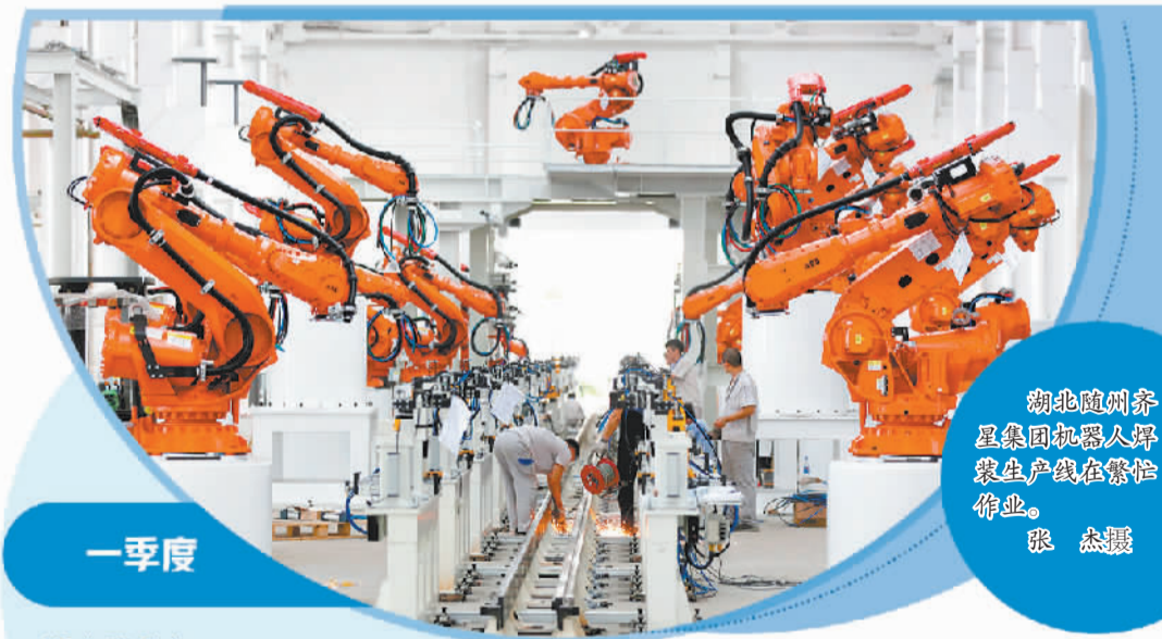
湖北随州齐星集团机器人焊接生产线在繁忙作业。

探索服务功能拓展。推动农业社会化服务由生产型服务向全产业链服务发展转变。以盘活存量设施、装备、技术、人才及各类主体作为重点,探索建设多种类型的农业综合服务中心。围绕农业全产业链发展,不仅提供农资供应、农机作业、农田管理、仓储物流、农产品营销等服务,还要积极探索拓展金融、保险、担保、期货、财务管理、经营管理、品牌创建、废弃物回收和大数据支撑等特色服务,实现更大范围的服务资源整合、供需有效对接,不断拓展农业社会化服务功能,促进农业生产提质增效。