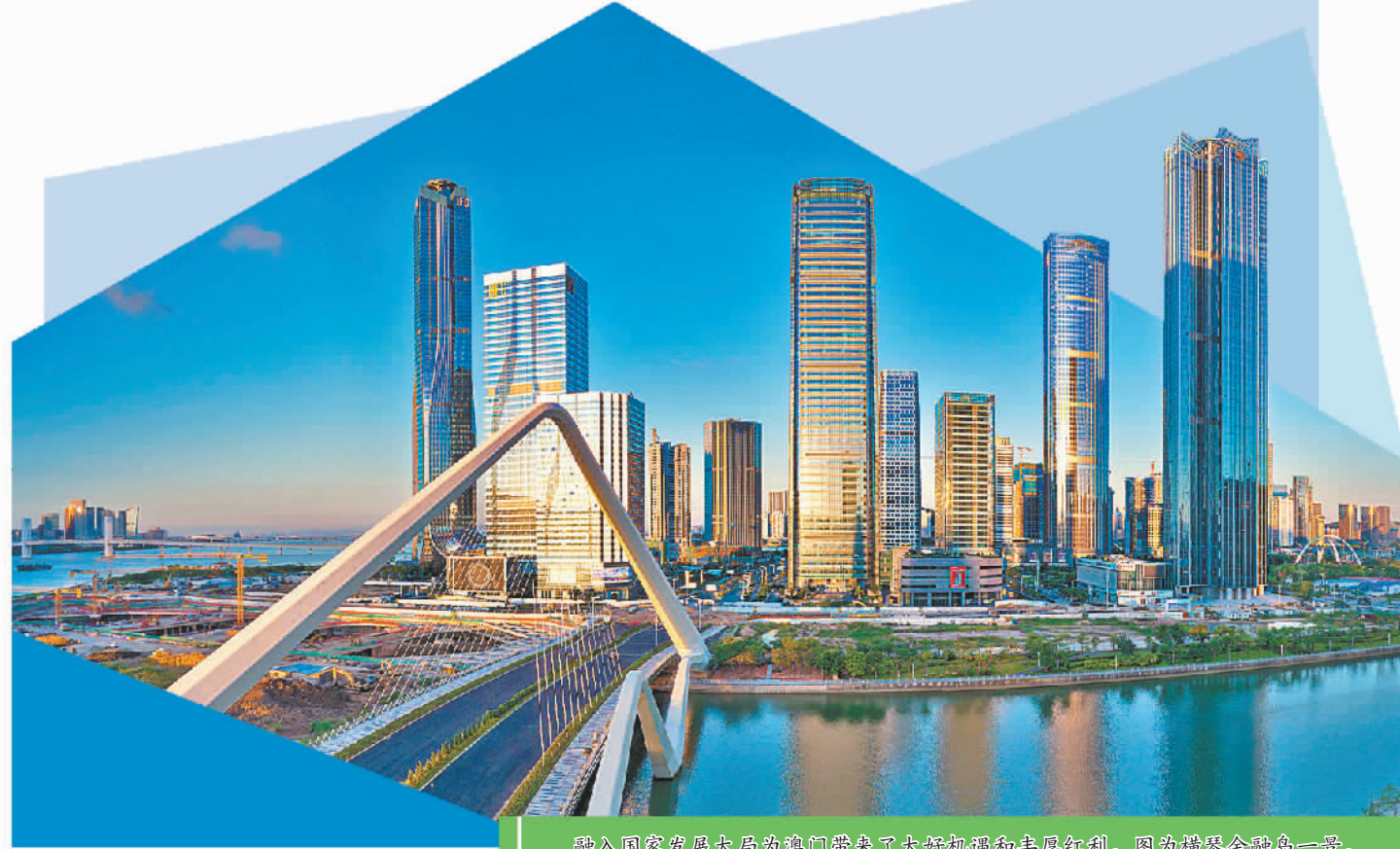
融入国家发展大局为澳门带来了大好机遇和丰厚红利。图为横琴会师岛一景。