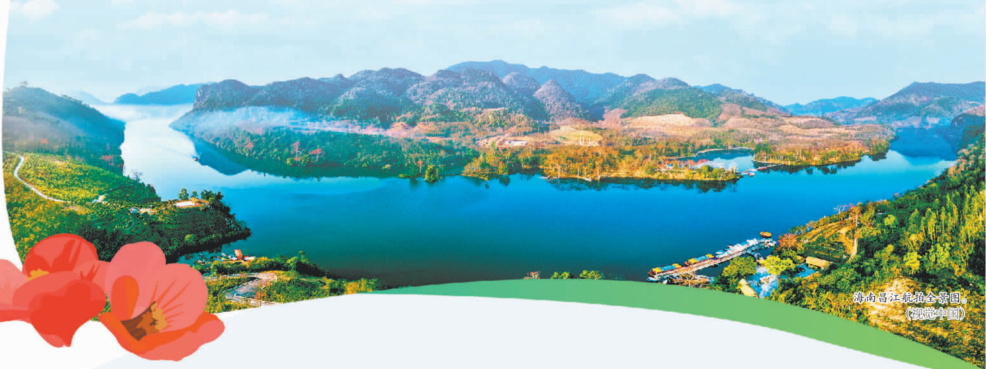
海南昌江航拍全景图。