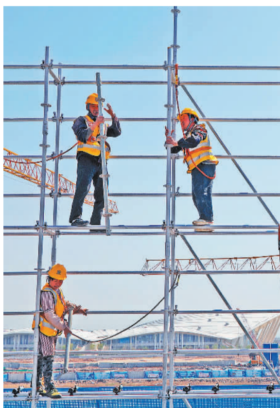
右图 4月29日,由中铁建工集团承建的山东省青岛市上合大厦项目现场,工人们施工正忙。该项目力争7月底主体结构封顶,建成后将成为青岛上合示范区国际会议交流、展览的主要场所。