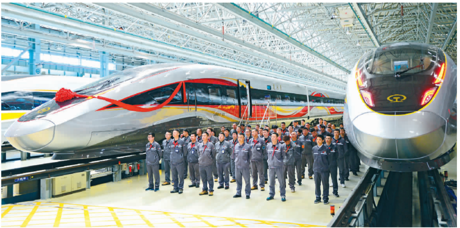
4月26日，复兴号智能动车组在长春中车长客股份有限公司下线，将投入济南到青岛高铁的客运服务。该动车组在16个方面增加了配置，具有科技智能、节能环保、安全舒适等特点。