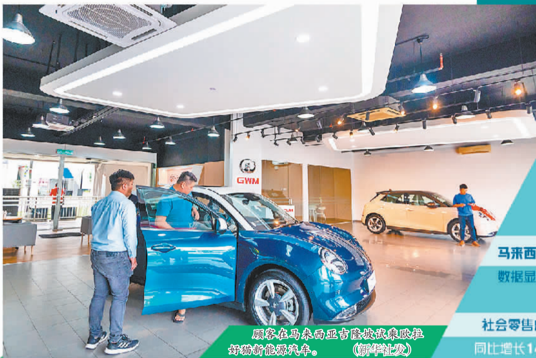
顾客在马来西亚吉隆坡试驾欧拉好猫新能源汽车。

为确保顺利实现今年的经济增长既定目标,马来西亚政府目前致力于发展经济的主要举措,基本可以概括为稳中求进、“三箭”齐发、注重民生、积极作为四个方面。