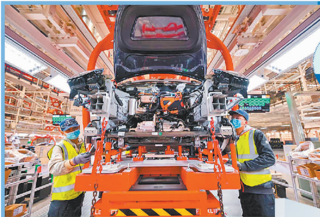
位于上海临港的特斯拉超级工厂总装车间一角。（资料图片）

便利化制度保证“软服务”，基础设施建设保证“硬支撑”。随着基地中各项政策的逐步落地，企业的获得感也在逐步增强。“在基地的支持下，特斯拉将出口重心由外高桥海通码头转移到‘家门口’的上海南港码头。”特斯拉公司相关负责人告诉记者，基地还协助解决了海关过卡手续等难