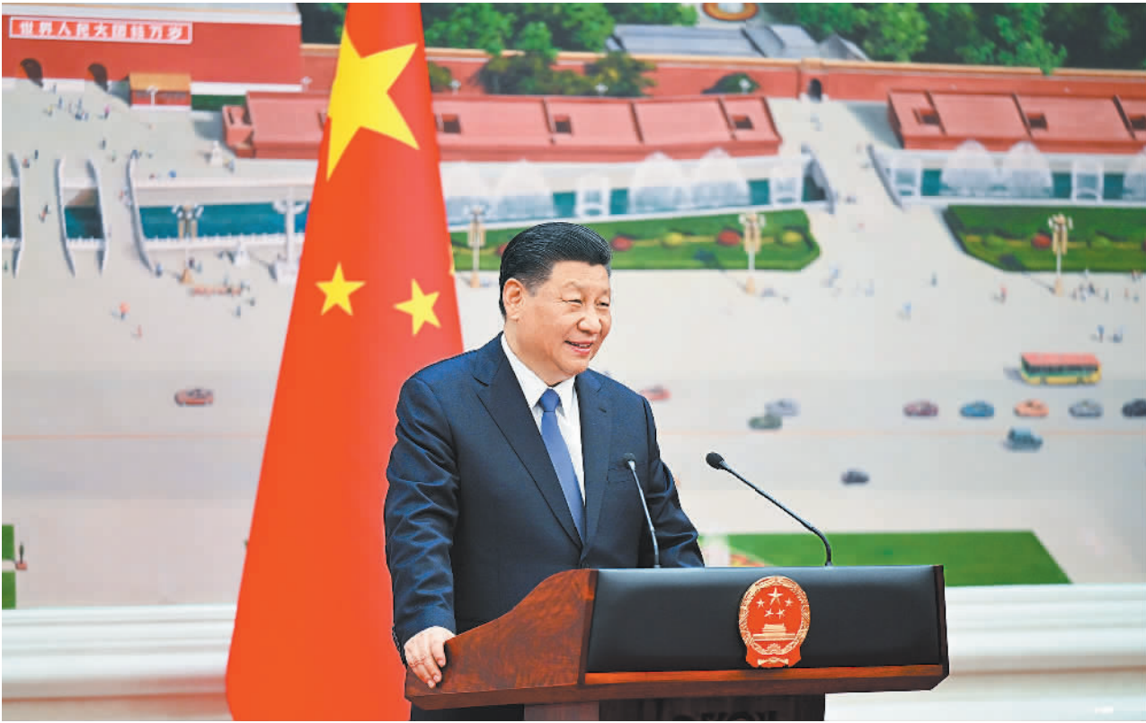
4月24日下午,国家主席习近平在北京人民大会堂接受70位驻华大使递交国书。这是递交国书仪式结束后,习近平在北京厅对使节发表集体讲话。

新华社北京4月24日电 国家主席习近平24日下午在人民大会堂接受70位驻华大使递交国书。