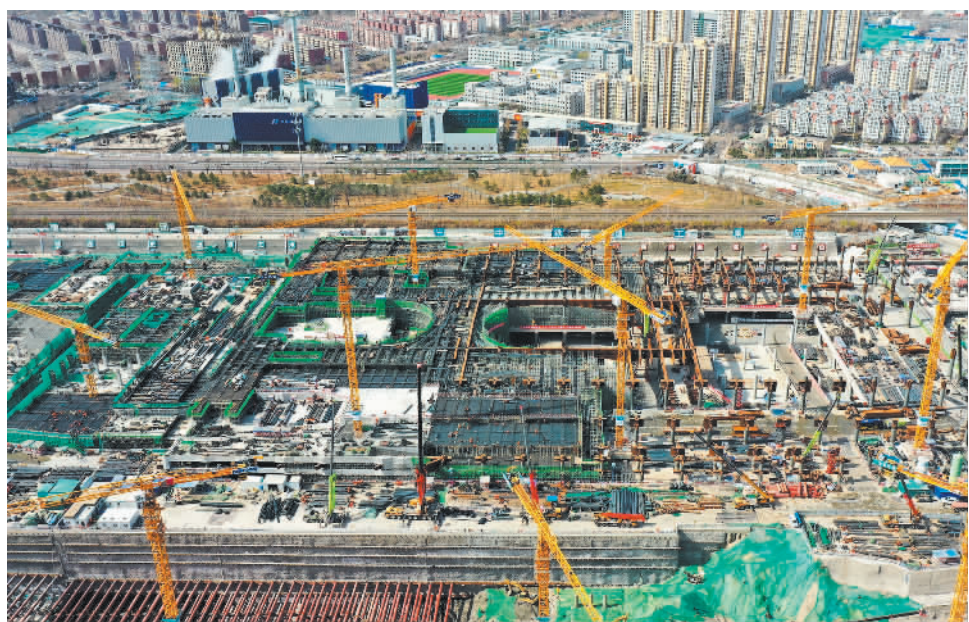
近日，中铁建工集团承建的北京城市副中心站综合交通枢纽站房核心区西侧钢结构完工。北京城市副中心站综合交通枢纽位于通州区潞城镇杨坨村，是亚洲最大的地下综合交通枢纽，也是“轨道上的京津冀”的重要节点。

“总体上看，目前我国的非全日制用工制度强调其灵活性和特殊性，应进一步贯彻非全日制用工和全日制用工劳动者平等保护的原则，完善非全日制用工合同订立、合同解除和终止以及社会保险等制度，更好保护非全日制用工劳动者的权益。”谢增毅说。