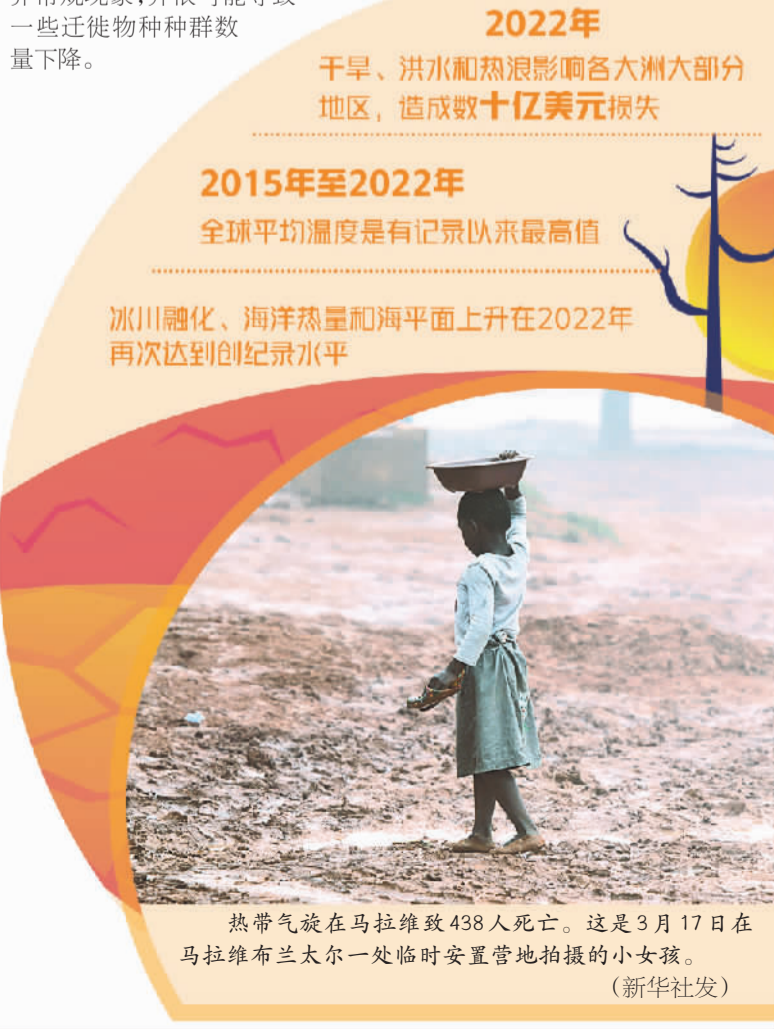
本版编辑 周明阳 孙亚军 美编 高妍

报告还谈及气候变化对生态系统和自然环境所产生的干扰性影响，包括影响树木开花或鸟类迁徙等自然规律现象，并很可能导致一些迁徙物种种群数量下降。