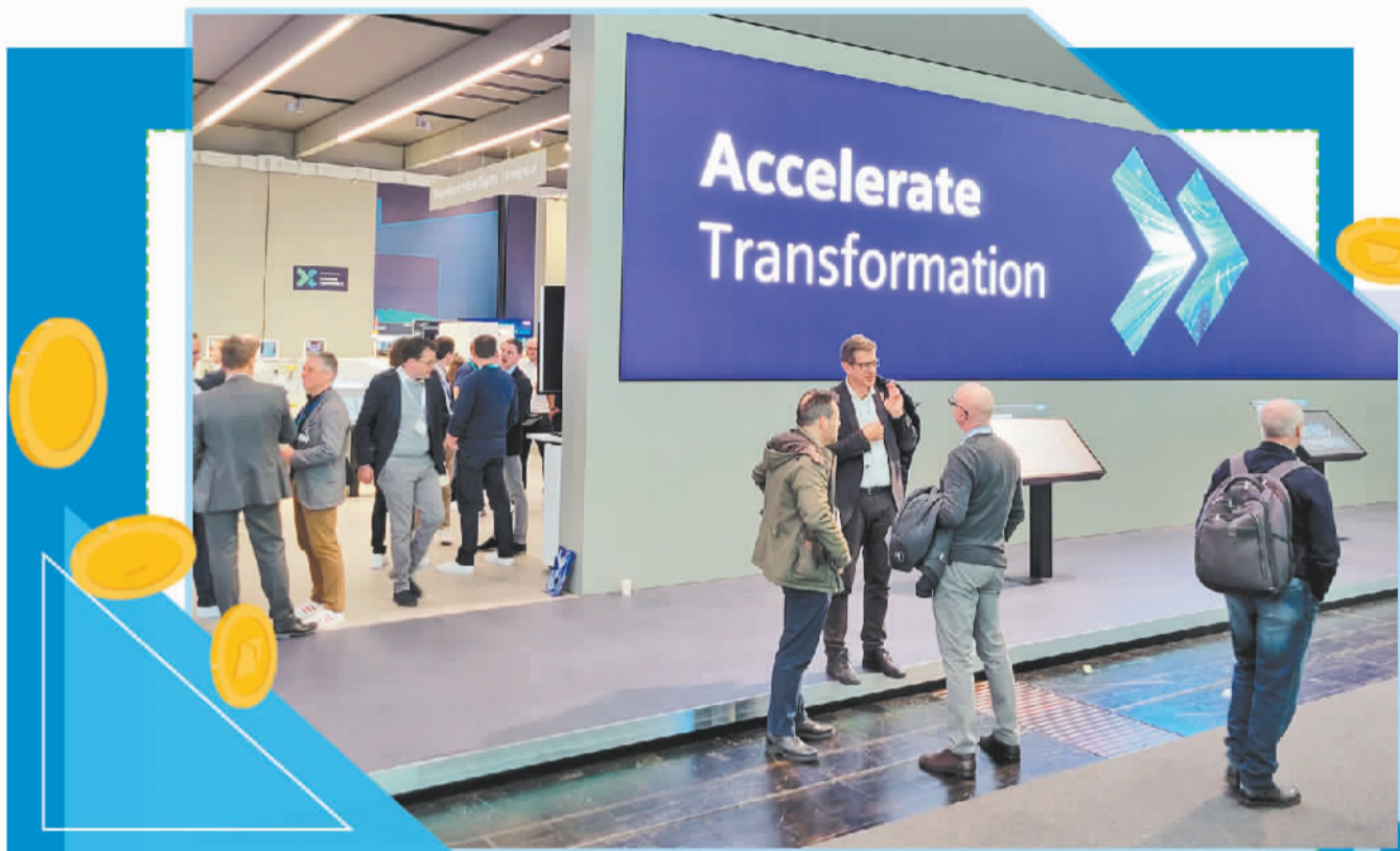
2023 汉诺威工业博览会上德国西门子公司展台。

得益于能源价格大幅下降、政府救济措施得力、国内制造业回暖与民众工资增长等因素，德国经济前景整体趋向好转。不过，在国际金融市场动荡的背景下，德国经济隐忧仍存。