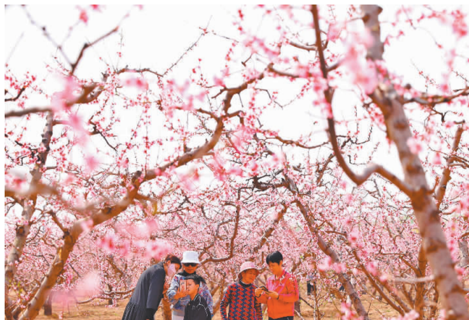
日前，游客在河北省廊坊市安次区葛渔城镇林海桃源景区观光拍照。近年来，该区不断优化农业产业结构，扩大果树种植面积，依托桃园大力发展乡村旅游观光产业，打造“赏花+采摘”旅游品牌，拓宽农民增收渠道。

用了6个月时间，瑞华成功从传统服装工厂升级为服装业的智能转型标杆。“改造后，瑞华实现了1件也可以定制‘小单快反’柔性生产，日产能从原本的不到9000件提升到12000件，产品生产周期由原来的20天减少到7天，管理效率提高80%。”程显玉对记者说，众多国内头部服装品牌也向瑞华投来了橄榄枝，企业订单量