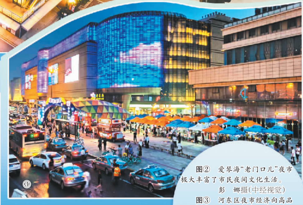
图③ 河东区夜市经济向高品质、多元化拓展。

天津四季主题促消费活动暨“津韵家园·夜购河东”夜生活节活动，2022年以提升河东烟火气为重点，举办脱口秀表演、“梅花博物馆”展览、音乐节、餐饮嘉年华等活动50余场。