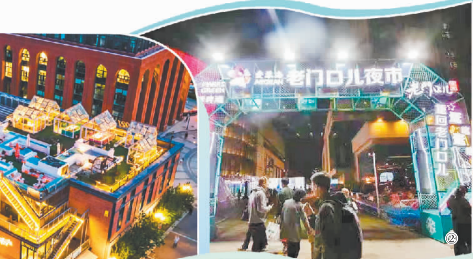
图② 爱琴海“老门口儿”夜市极大丰富了市民夜间文化生活。

围绕加快打造“夜河东”品牌，河东区联动各夜市街区开展夜品、夜购、夜游、夜赏等多元夜间消费活动。2020年举办以“酷爱津城潮流集市节”为主题的活动，2021年举办