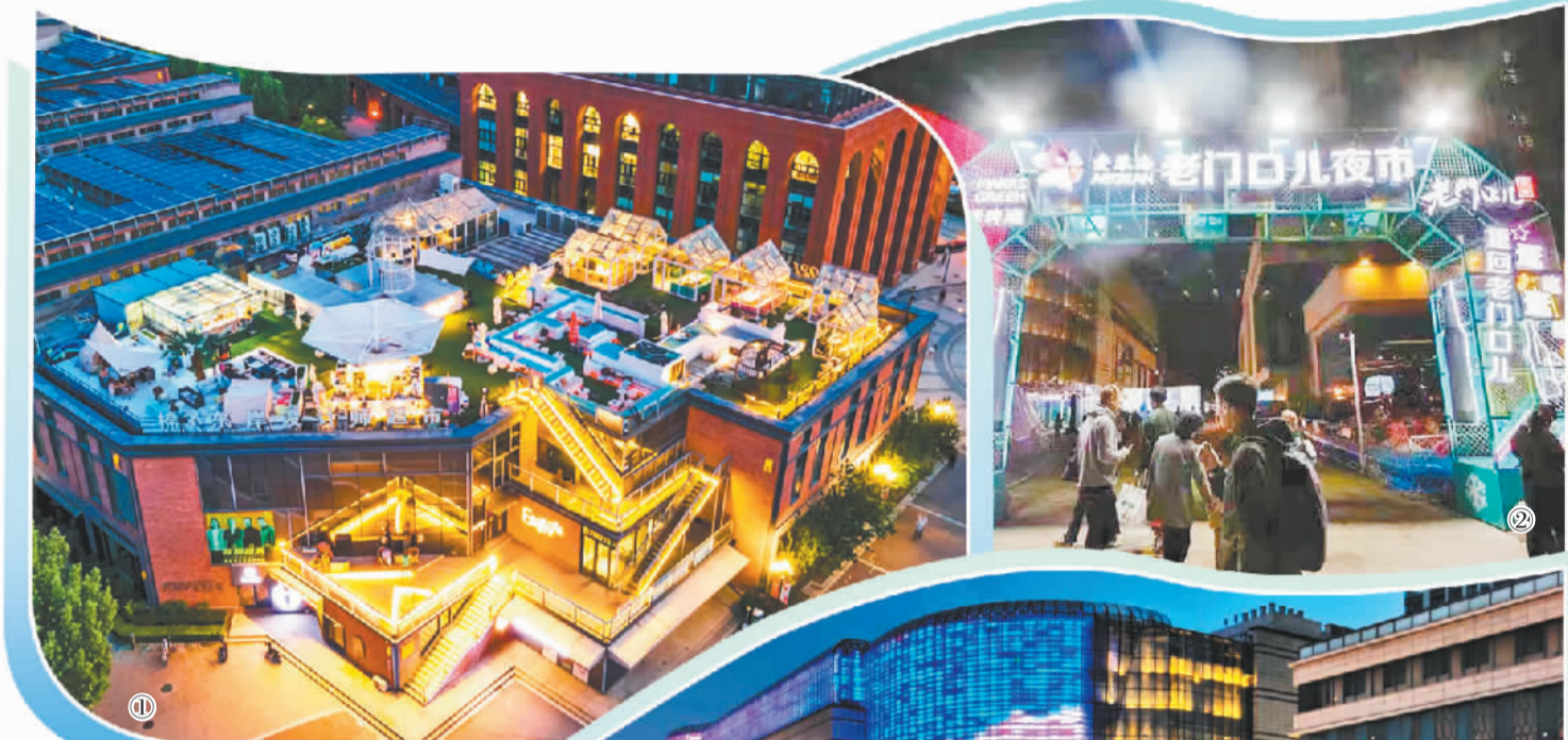
图① 天津市河东区棉3创意街区夜市，前来游览消费的市民络绎不绝。

经过3年多的发展，河东区发挥爱琴海“老门口儿”夜市的示范带动作用，推广复制打造远洋“老门口儿”夜市，持续推进万达“幸福里”、棉3文创主题夜市、金地“后浪市集”等区级夜市提质增效，形成了长期夜市与短期市集互补、商旅文体相互融合的夜间经济发展体系，构建了津滨大道综合性夜生活