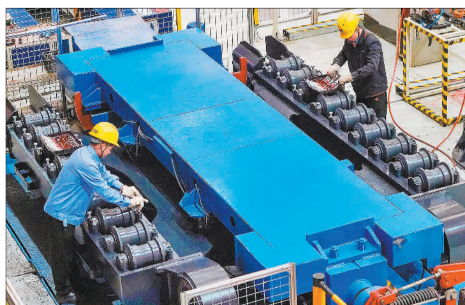
►3月31日,广西柳工集团有限公司员工忙生产。柳工集团坚持创新驱动发展,加快智能化、新能源、大数据和工业互联网等新技术的应用研发,实现科技自立自强。