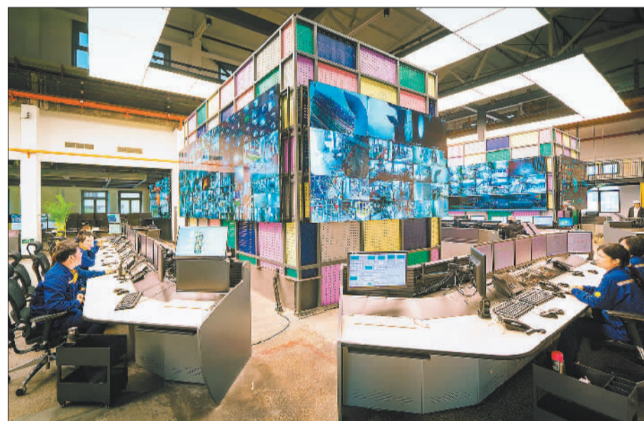
▼4月6日,广东省韶关钢铁集团智慧中心员工查看监控,精心组织生产。韶钢以智慧中心建设为主线,积极创建“智能工厂”,实现跨工序、跨区域、远距离、大规模集控、无边界协同和大数据决策新型管控运营模式。