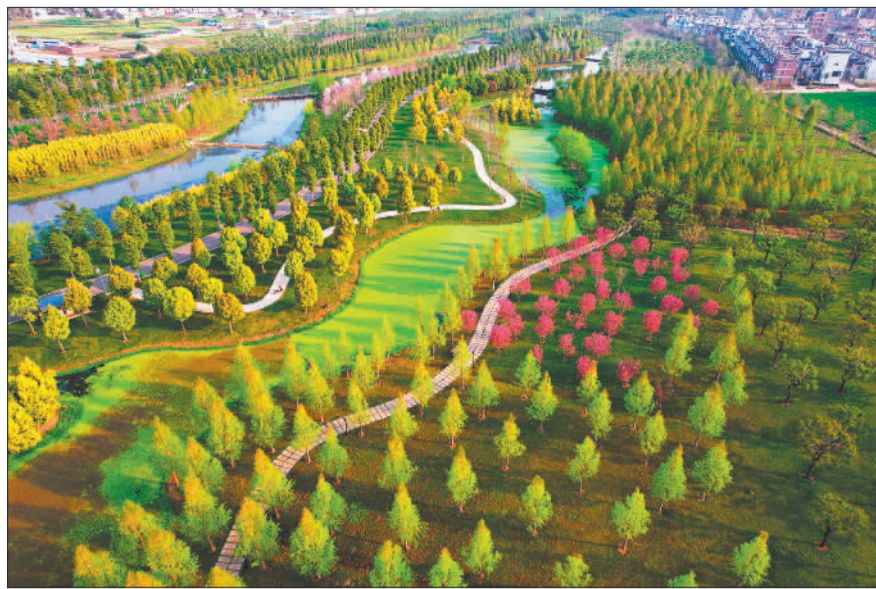
▲云南省弥勒市通过治污、治水、生态、景观、旅游为一体的河道综合治理,使甸溪河成为水清河畅、人水和谐的城市生态绿色发展空间带。