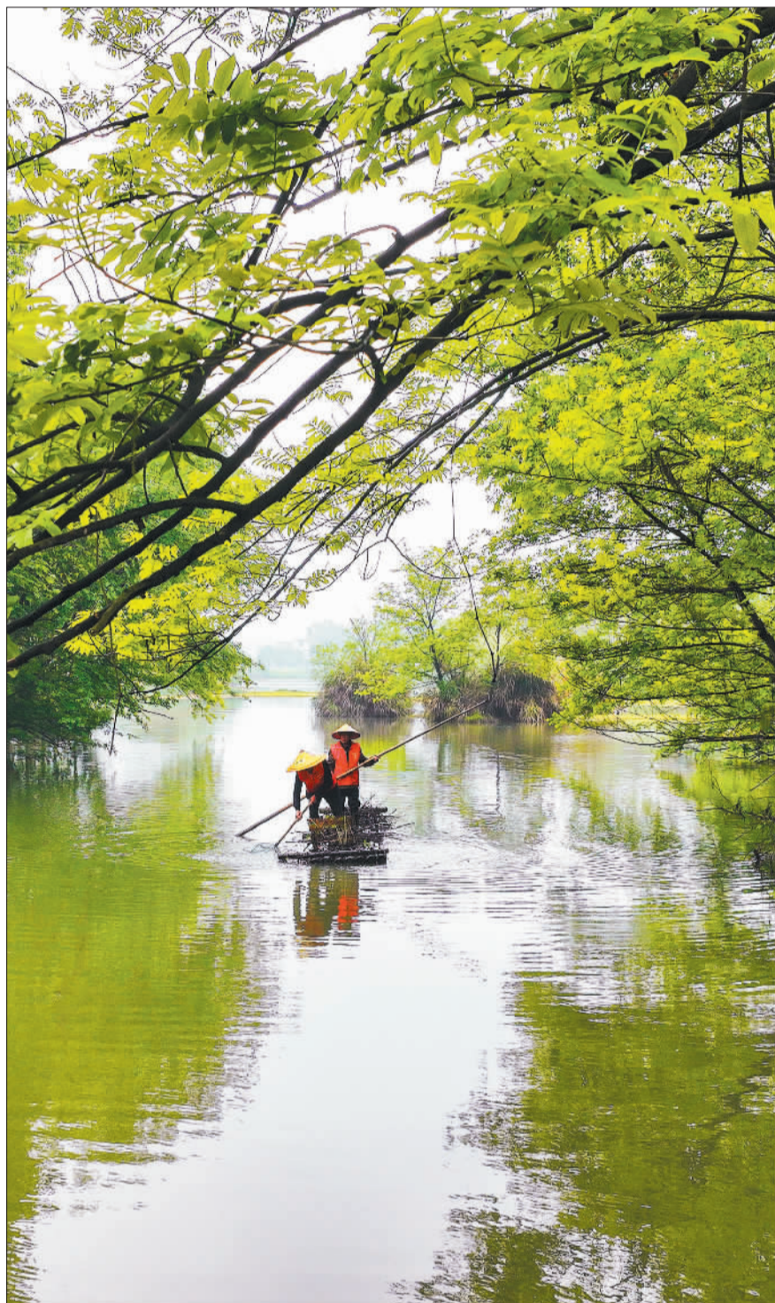
▲湖南省常宁市沙水河三角塘镇河段,河道保洁员在打捞漂浮物。常宁市严格落实河(湖)长制,打造“河畅、水清、岸绿、景美”的水环境。