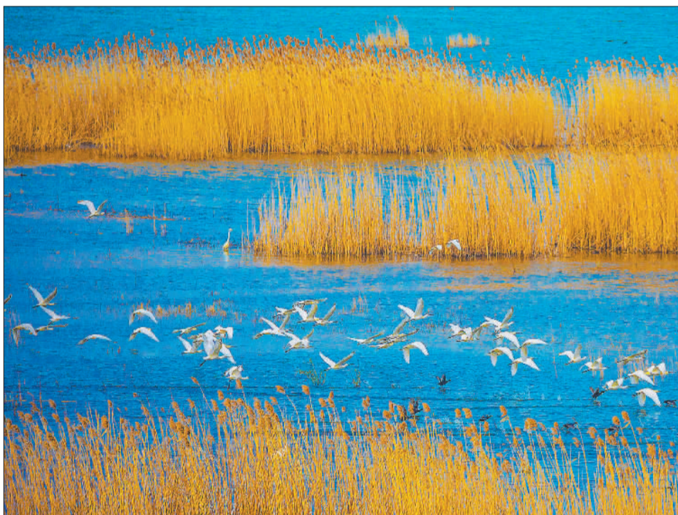
▲江苏省泗洪县洪泽湖湿地,白琵鹭在水中嬉戏。洪泽湖湿地生态修复后,水系得到进一步疏通,鸟类等野生动物种类和数量明显增多。