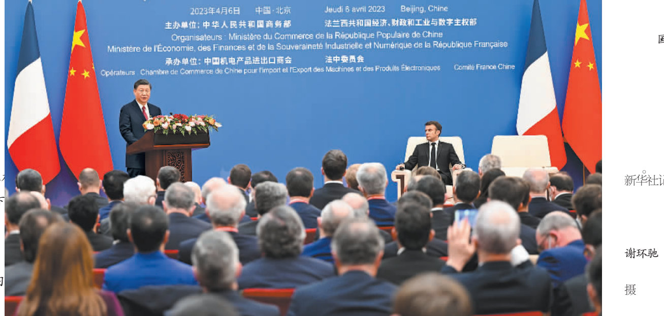
新华社北京4月6日电(记者刘华)4月6日下午,国家主席习近平在北京同法国总统马克龙共同出席中法企业家委员会第五次会议闭幕式并致辞。习近平指出,世界正发生深刻复杂

变化。面对困难和挑战,中法两国坚持真正的多边主义,坚持自由贸易和经济全球化正确方向,极大增强了双边经贸合作的韧性和活力。双边贸易额和相互直接投资稳步增长,大项目合作深入