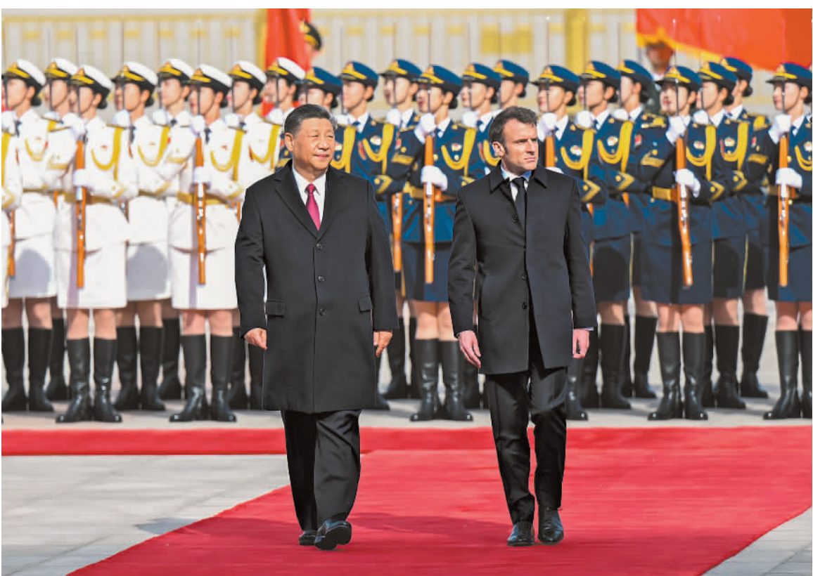
克龙同总统马克龙 四月六日下午