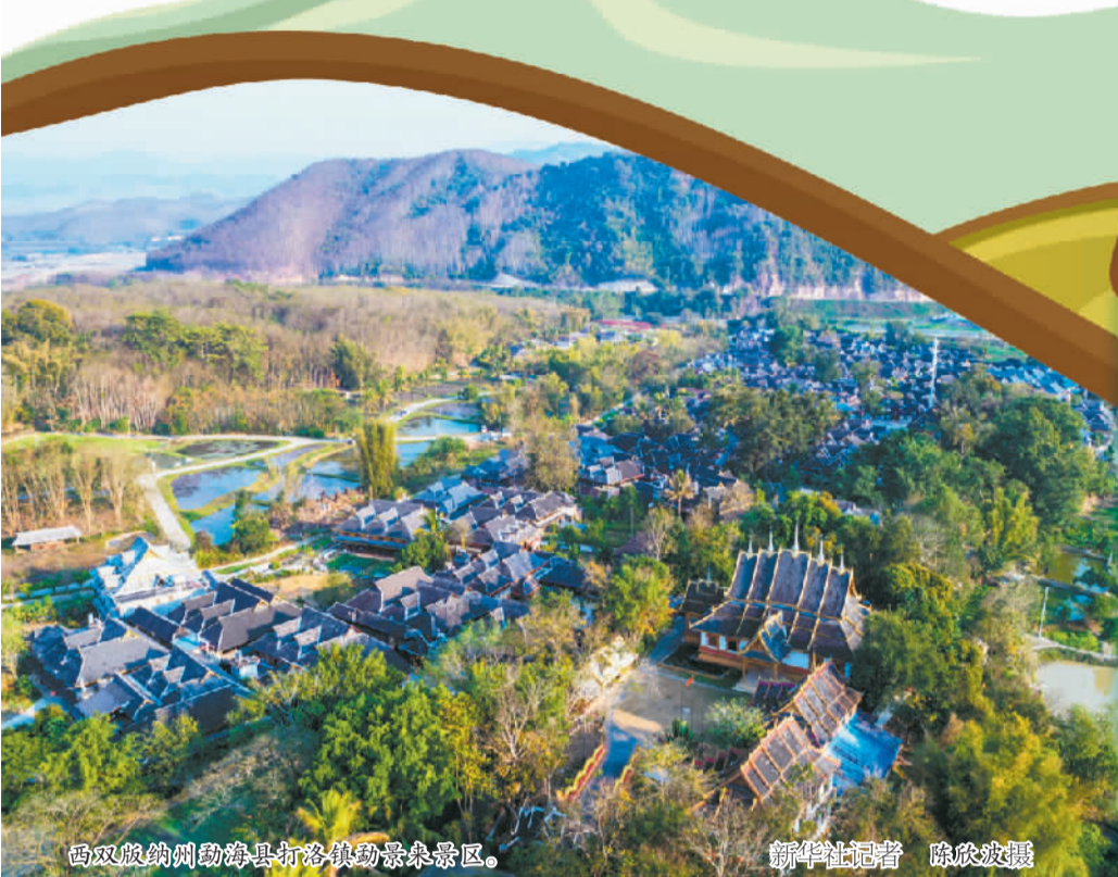
西双版纳州勐海县打洛镇勐景象景区。

在西双版纳野象谷景区，每天都有大批游客来此。2021年，野生亚洲象“北上南归”的旅行，让人与自然和谐共生的故事传播到世界。目前西双版纳野生亚洲象数量由20世纪80年代的170多头增至300多头，并受到严格保护。