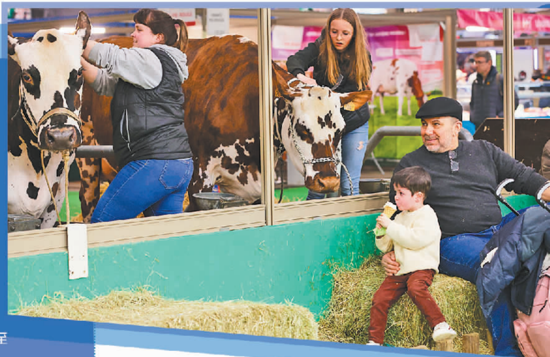
图为2月27日在法国巴黎拍摄的第59届法国国际农业博览会现场。