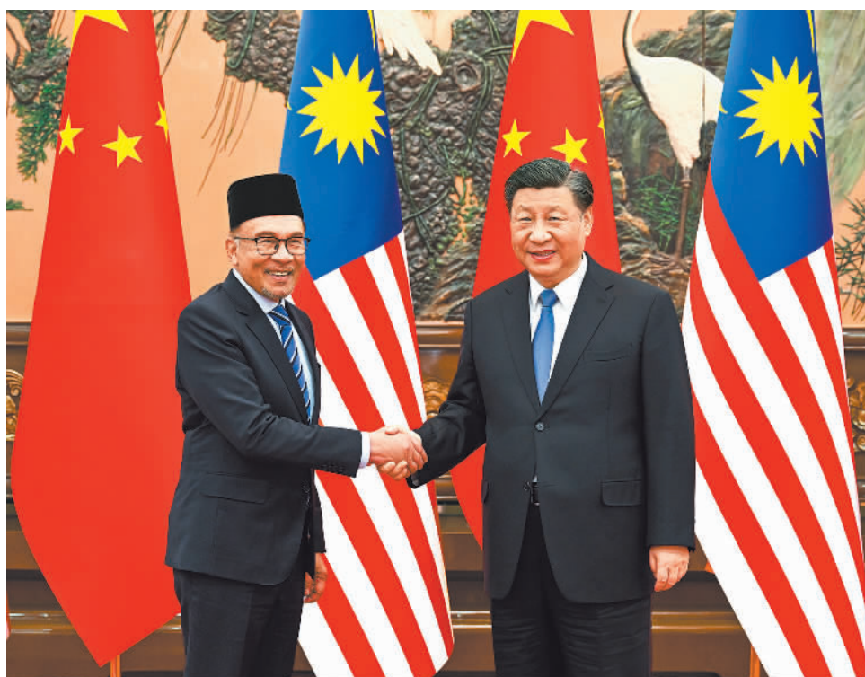
3月31日下午，国家主席习近平在北京人民大会堂会见来华进行正式访问的马来西亚总理安瓦尔。

新华社北京3月31日电(记者郑明达)3月31日下午，国家主席习近平在人民大会堂会见来华进行正式访问的马来西亚总理安瓦尔。