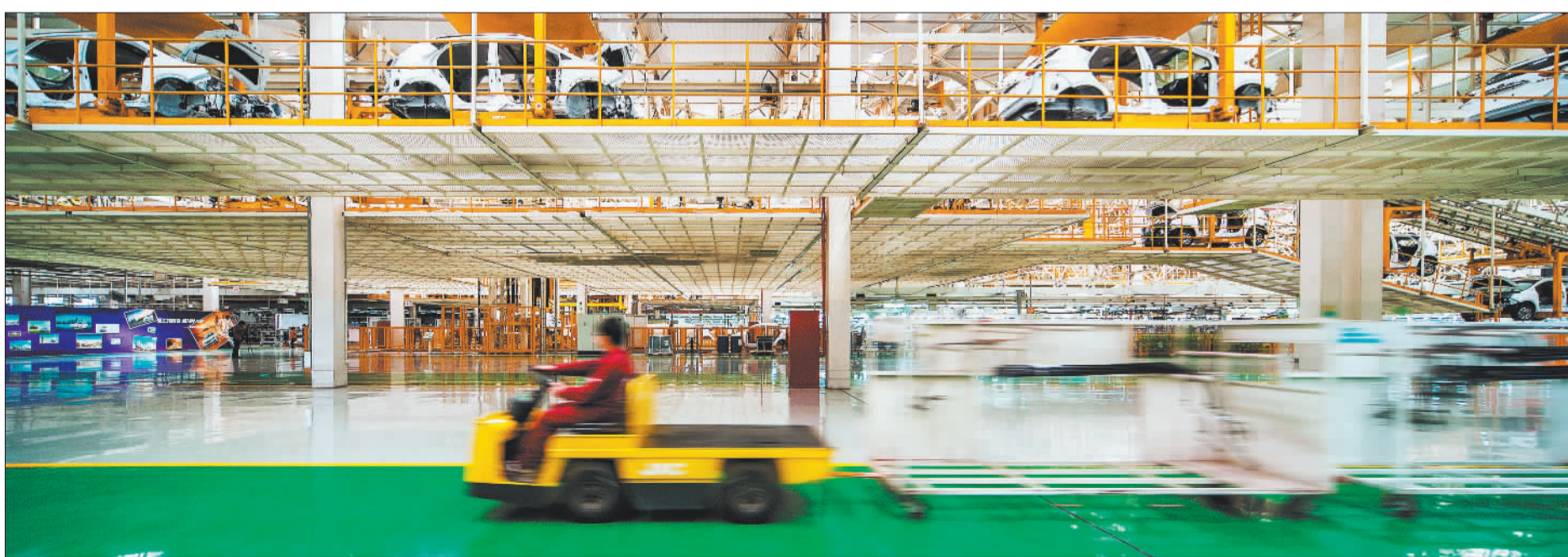
▼合肥江淮汽车制造集团依靠创新推进质量攻关,不断提升企业核心竞争力。