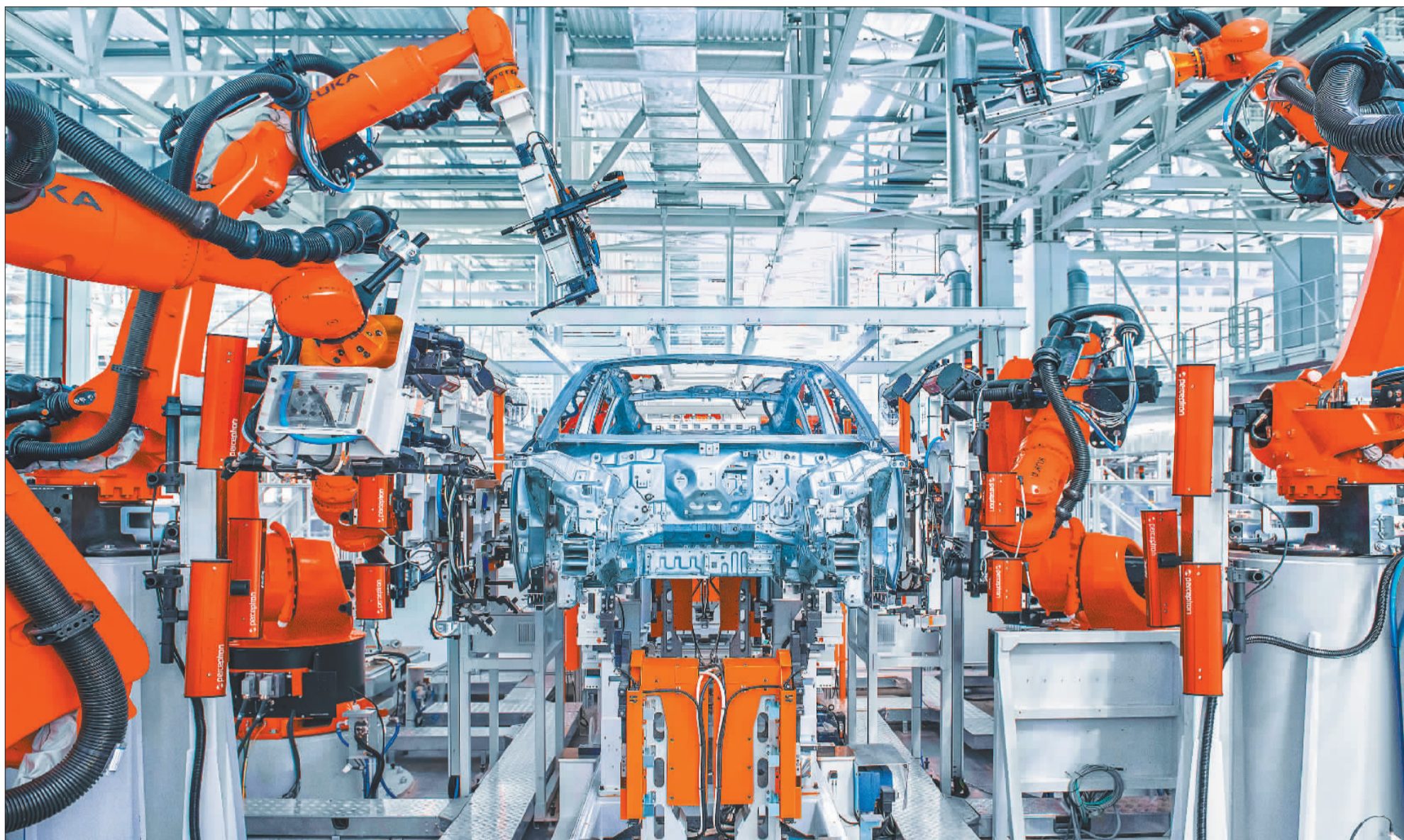
▲合肥新桥智能电动汽车产业园高端智能工厂。产业园将开展整车、核心零部件、自动驾驶等创新性研发,打造具有全球竞争力、引领性的创新链。项目建成后将实现年产整车110万辆、产值超5000亿元。