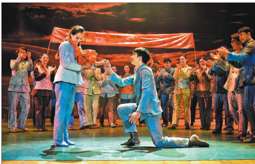
▲近年来，克拉玛依文化产业蓬勃发展。舞剧《油城往事》以上世纪五六十年代的克拉玛依为创作背景，再现了创业者不畏艰难、砥砺奋进，投入到油田开发建设的火热场景。 ▼坐落在克拉玛依的一处光伏电站。当地积极调整产业结构，努力打造以沙漠、戈壁、荒漠为重点的国家大型风电太阳能发电基地，建设以新能源为主的新型电力系统。