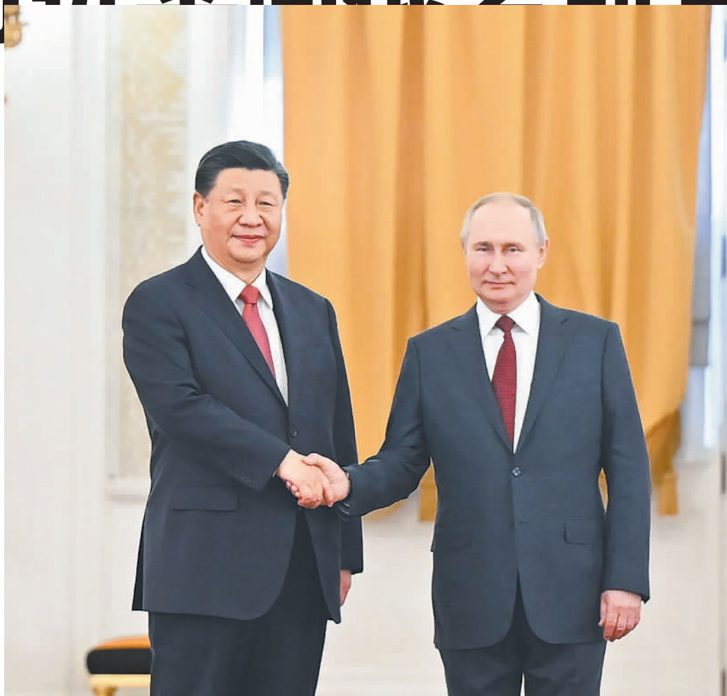
当地时间3月21日下午,国家主席习近平在莫斯科克里姆林宫同俄罗斯总统普京举行会谈。普京在乔治大厅为习近平举行隆重欢迎仪式。这是两国元首紧紧握手,合影留念。

新华社莫斯科3月21日电(记者倪四义 范伟国)当地时间3月21日下午,国家主席习近平在莫斯科克里姆林宫同俄罗斯总统普京举行会谈。两国元首就中俄关系及共同关心的重大国际和地区问题进行了真挚友好、富有成果的会谈,达成许多新的重要共识。双方一致同意,本着睦邻友好、合作共赢原则推进各领域交往合作,深化新时代全面战略协作伙伴关系。