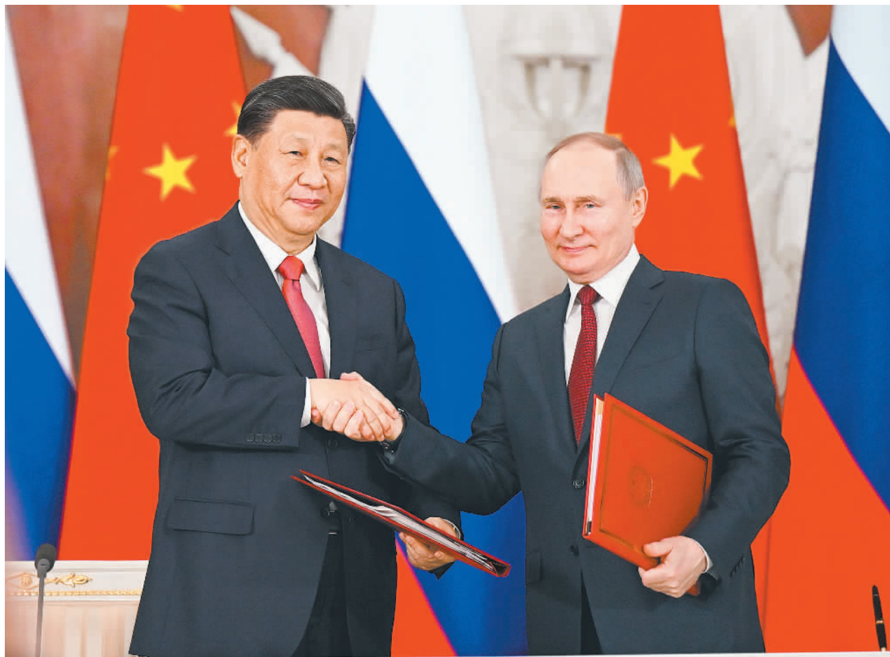
当地时间3月21日下午,国家主席习近平在莫斯科克里姆林宫同俄罗斯总统普京举行会谈。这是会谈后,两国元首共同签署《中华人民共和国和俄罗斯联邦关于深化新时代全面战略协作伙伴关系的联合声明》和《中华人民共和国主席和俄罗斯联邦总统关于2030年前中俄经济合作重点方向发展规划的联合声明》。