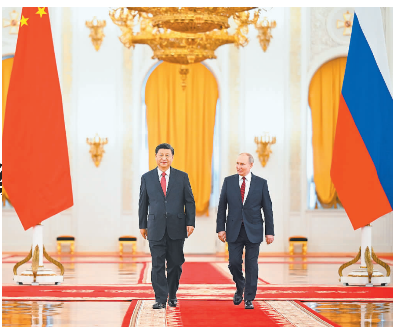
当地时间3月21日下午,国家主席习近平在莫斯科克里姆林宫同俄罗斯总统普京举行会谈。这是普京在乔治大厅为习近平举行隆重欢迎仪式。

当晚,普京在克里姆林宫为习近平举行了隆重欢迎宴会。蔡奇、王毅、秦刚,以及俄罗斯联邦政府领导人出席上述活动。