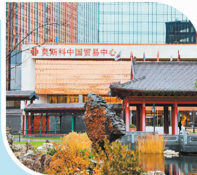
莫斯科中国贸易中心。本报记者 李春辉摄

应俄罗斯联邦总统普京邀请，国家主席习近平将于3月20日至22日对俄罗斯进行国事访问。就此，中国驻俄罗斯大使张汉晖接受经济日报记者采访。