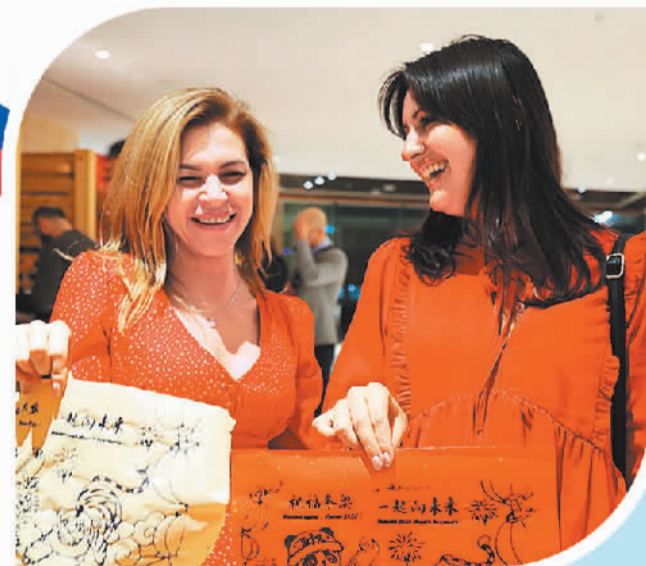
俄罗斯民众体验中国春节文化。

盖伊达表示，增加对中国市场的能源供应需要建造额外的管道基础设施，但与此同时，俄将最大限度地利用“西伯利亚力量”管道和液化天然气出口。俄将争取到2030年将液化天然气产量提高到1亿吨。目前，“亚马尔液化天然气”项目产能达1740万吨，“萨哈林-2号”项目达980万吨，“北极LNG-1”“北极LNG-3”等液化天然气项目处于规划中。“远东天然气项目”和“萨哈林-2号”项目扩建也已经在讨论中。专家表示，对于俄罗斯来说，西方出口前景的恶化意味着俄将向东方寻求出口多元化。在此背景下，到本世纪30年代初，俄向中国供应的管道天然气量最高或可达1300亿立方米，通过西线向中国供气量或将达500亿立方米。