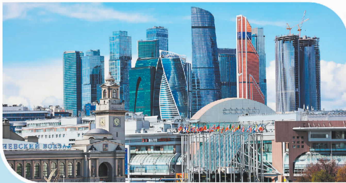
位于莫斯科河畔普雷斯区的CBD。

习近平主席此次对俄进行国事访问，对新时代中俄关系具有里程碑意义，将为中俄关系注入强大的推动力，引领两国关系在高水平上持续向前发展。世界越是动荡不安，中俄关系越应稳步向前。面对复杂严峻的国际局势，中方愿同俄方一道，维护和平安全与发展繁荣，携手构建人类命运共同体，共同落实“一带一路”倡议，推动两国务实合作实现跨越式发展，把新时代中俄关系不断推向前进。