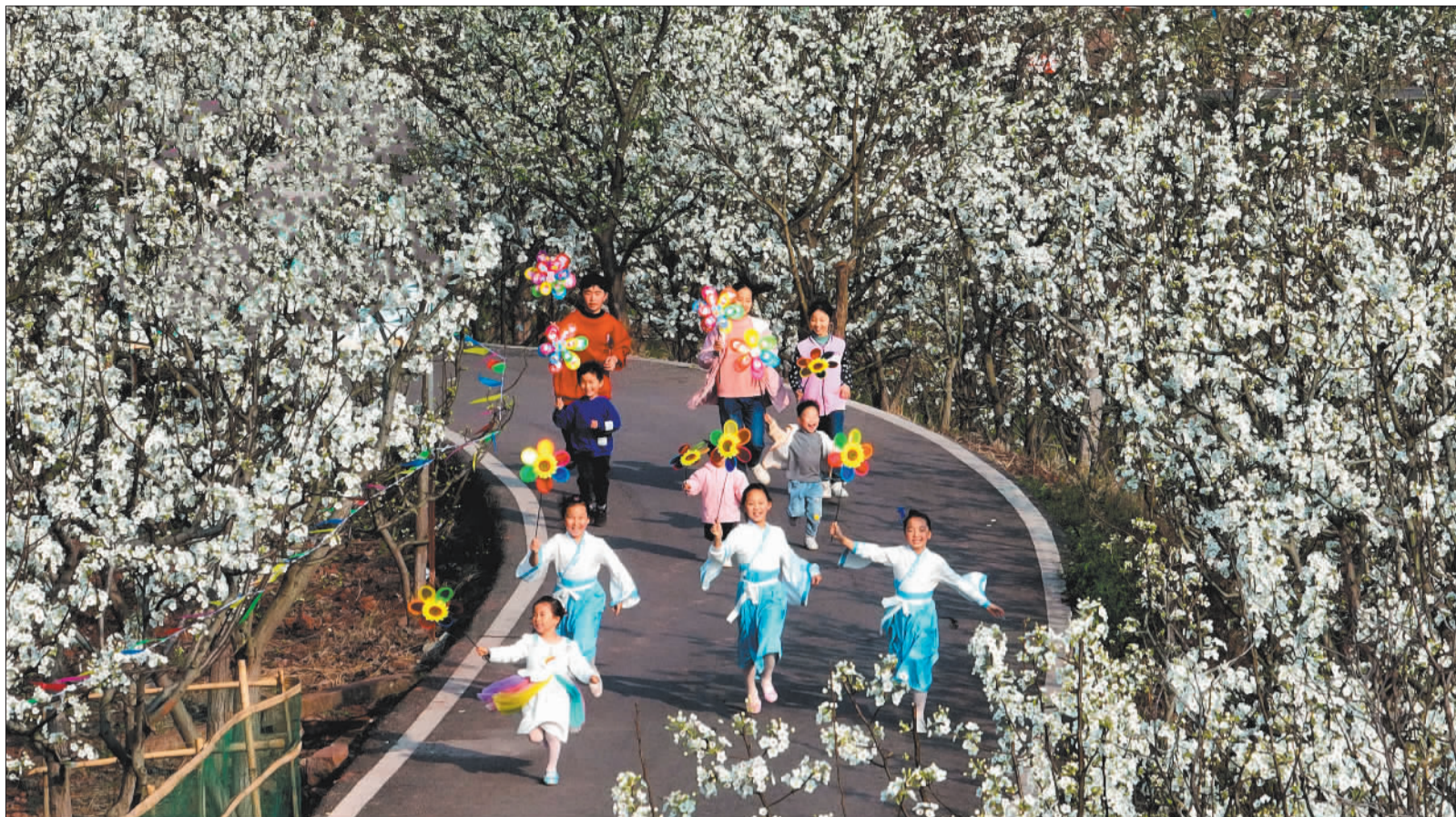
▲四川省眉山市仁寿县曹家镇的3.2万亩梨花竞相绽放,吸引众多游客前来踏春赏花。