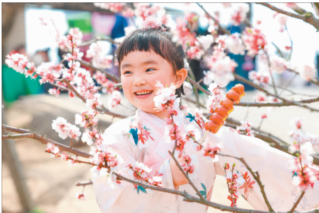
►小朋友在湖北省襄阳市襄城区尹集镇肖冲村杏花林中游玩。