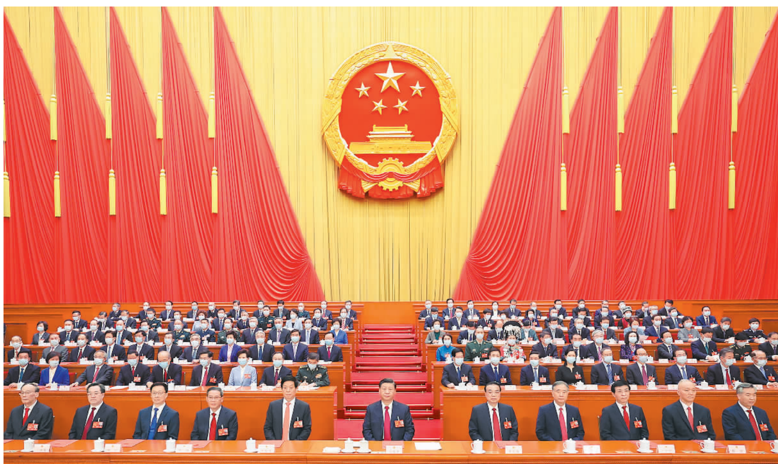
3月13日,第十四届全国人民代表大会第一次会议在北京人民大会堂闭幕。中共中央总书记、国家主席、中央军委主席习近平发表重要讲话。