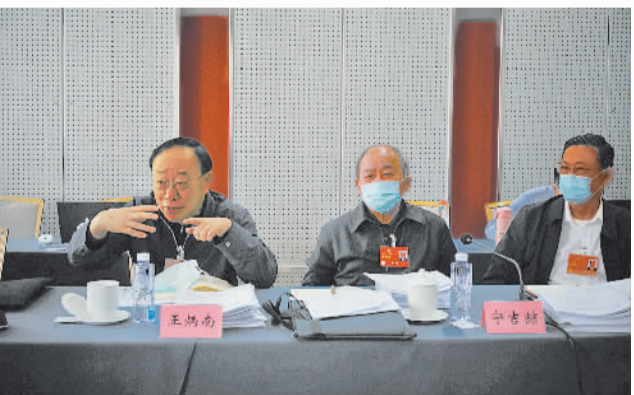
3月8日上午,出席全国政协十四届一次会议的经济界委员在小组会议上积极发言,围绕审议政协章程修正案草案等话题展开讨论。