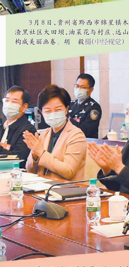
3月8日，十四届全国人大一次会议黑龙江代表团举行小组会议，审议全国人大常委会工作报告。本报记者 张倩摄

“不谋全局者，不足谋一域”。坚持从大局出发考虑问题，是习近平总书记向全党反复强调的立场和方法。中央经济工作会议提出，要更好统筹经济政策和其他政策，增强全局观，加强与宏观政策取向一致性评估。今年政府工作报告提出，要坚持稳字当头、稳中求进，保持政策连续性针对性，加强各类政策协调配合，形成共促高质量发展合力。