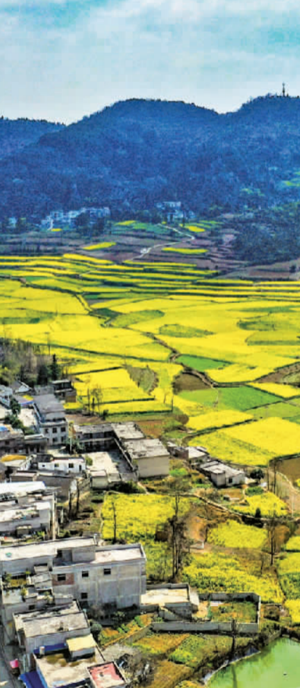
3月8日，贵州省黔西市锦里镇木渣黑社区大田坝，油菜花与村庄、远山构成美丽画卷。