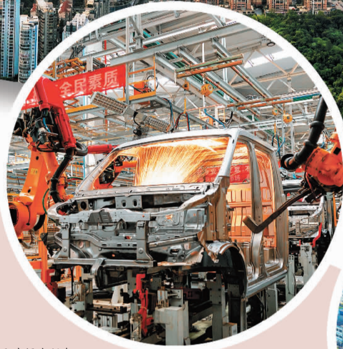
凯马冲焊车间智能机器人作业