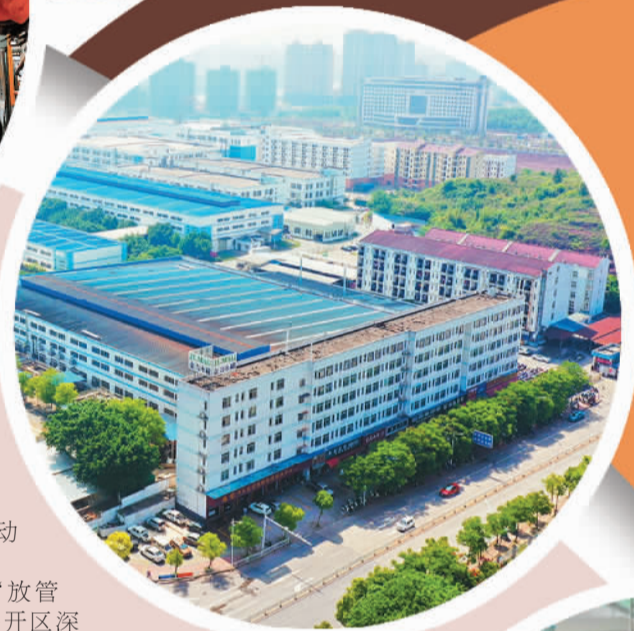
江西金力永磁科技股份有限公司