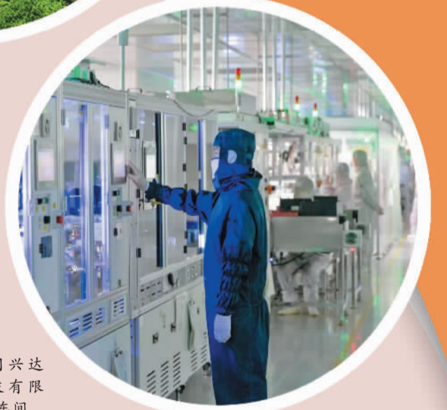
赣州市同兴达电子科技有限公司生产车间