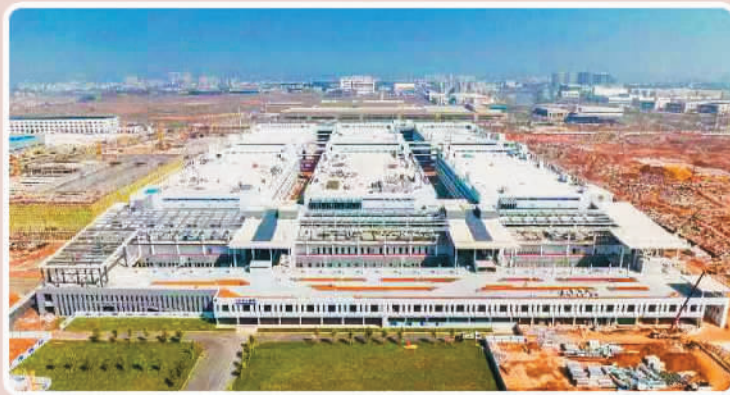
富士康(赣州)智能制造项目