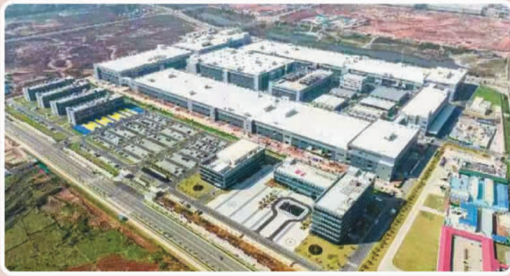
吉利(赣州)42GWh动力电池项目