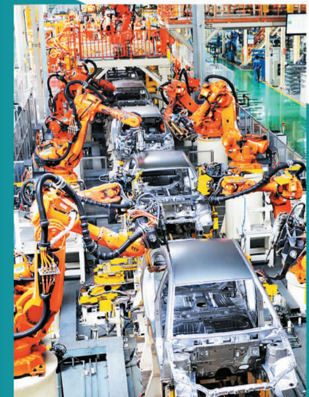
吉利汽车自动化生产流水线