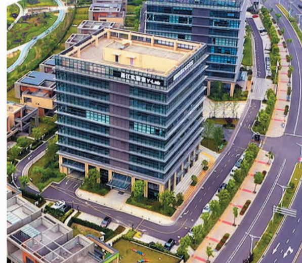
建设中的宁波科创中心