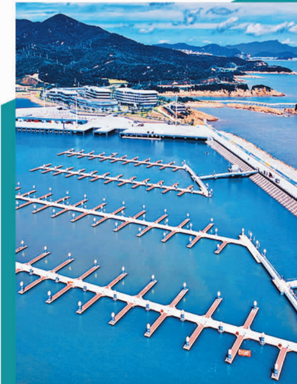
宁波象山亚帆中心