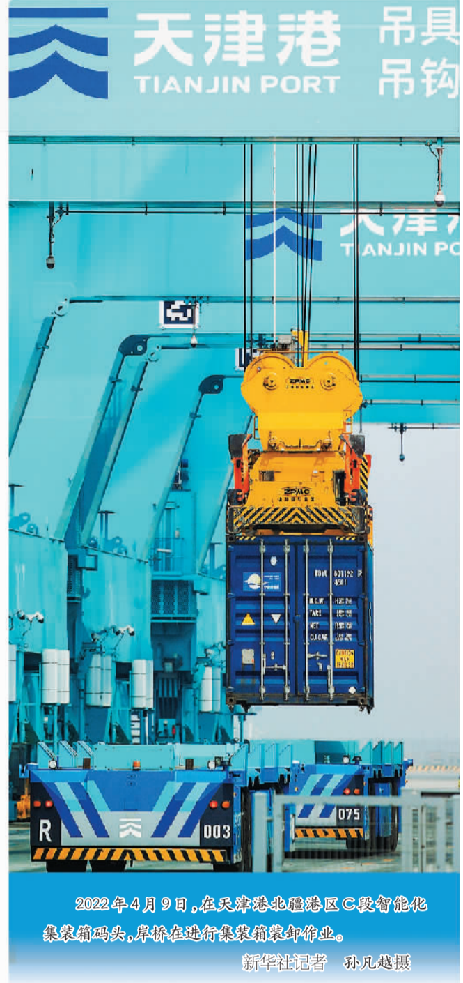
2022年4月9日，在天津港北疆港区C段智能化集装箱码头，岸桥正在进行集装箱装卸作业。