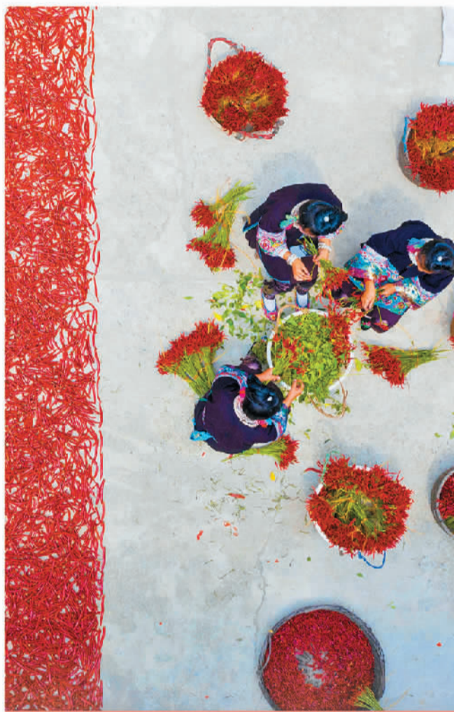
2021年9月12日，贵州省从江县东朗镇摆柯村村民在分拣朝天椒。

当前，口岸对稳链固链强链和地区协调发展的促进作用越来越明显。“新疆口岸发展依然面临基础设施薄弱、检测实力不足、口岸现代化建设偏弱等问题。接下来，我们将进一步完善口岸基础设施建设，不断优化陆路边境口岸规划布局，增强陆路边境口岸综合服务能力，推进口岸数据国际间互联互通，继续统筹推进口岸与其他对外开放平台协调发展，建立衔接长效机制。”李兰代表说。