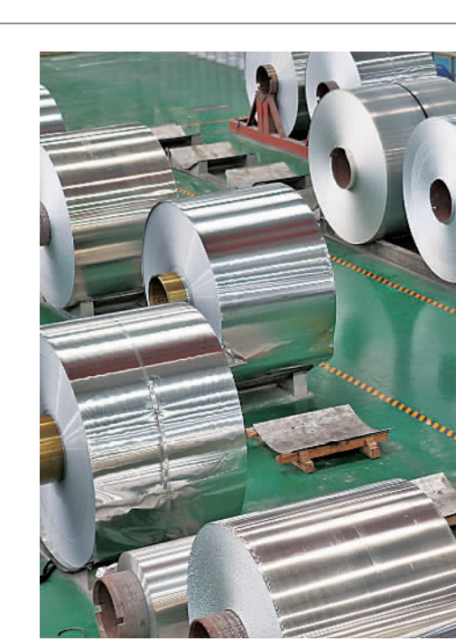
2 月 28 日,工人在位于重庆市黔江区工业园区的京宏源铝业有限公司生产车间吊运铝产品。黔江区工业园区是以农产品加工、新材料、生物医药、节能环保等为主导产业的园区。目前,园区企业加班加点赶制订单,力争一季度取得好成绩。