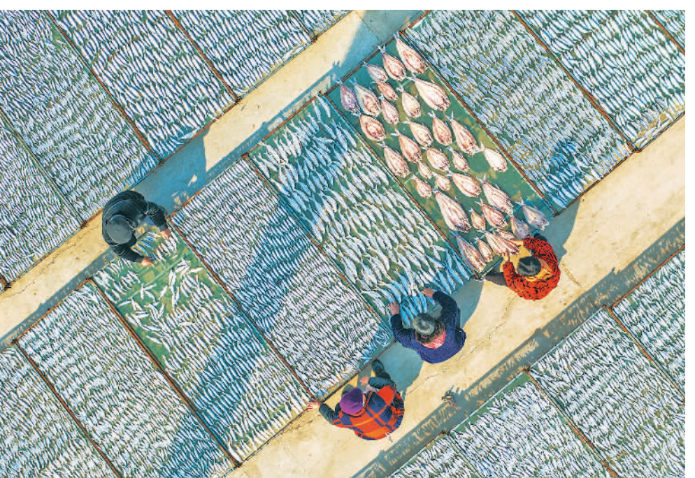
2月20日,江苏省宿迁市泗洪县龙集镇上咀居养殖户们在湖畔晾晒鱼干。龙集镇位于全国五大淡水湖之一的洪泽湖西岸,是典型的水乡。近年来,该镇充分利用当地优质水资源优势,大力发展水产养殖业,积极引导养殖户常年腌制、晾晒、加工、销售各类鱼干,并形成产业链,让小鱼干做成了大产业,年销量达300吨,实现强村富民。

2022年上半年,大冶市红鑫模具科技有限公司启动了3期项目建设。由于用电线路建设未能及时跟上,导致工程进度相对滞后。企业在亲商政企“午茶会”上反映后,大冶供电公司主动联系企业,协商解决用电问