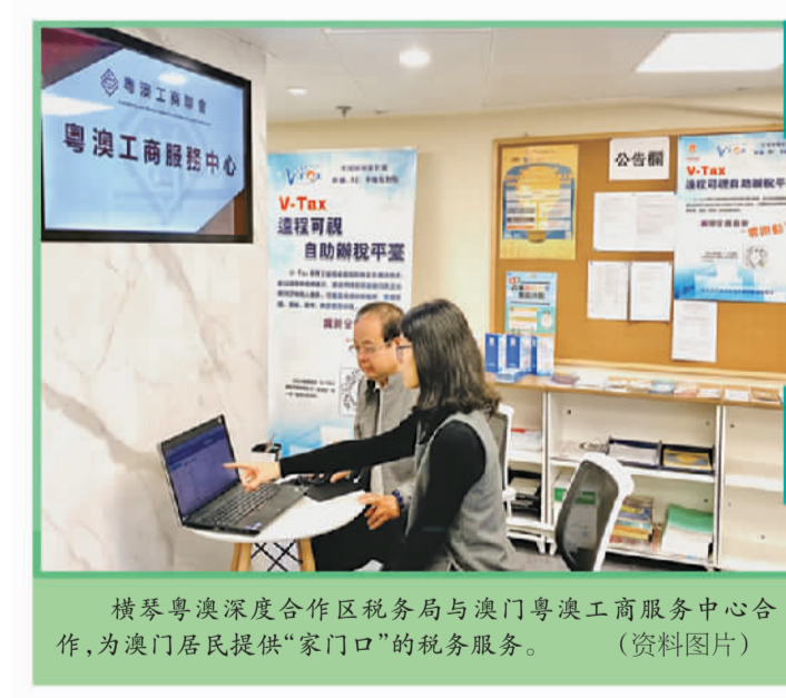
横琴粤澳深度合作区税务局与澳门粤澳工商服务中心合作,为澳门居民提供“家门口”的税务服务。(资料图片)

近年来深圳携手湾区多地创新实施的“大湾区组合港”项目,将深圳港口货源腹地纵深拓展至珠三角内河沿线码头,传统转关模式被精简为“一次申报、一次查验、一次放行”。组合港项目启动3年,至今已开通线路28条,覆盖大湾区近90%的城市,货物平均堆存期由7天缩短至2天,有效增强了大湾区港口群的