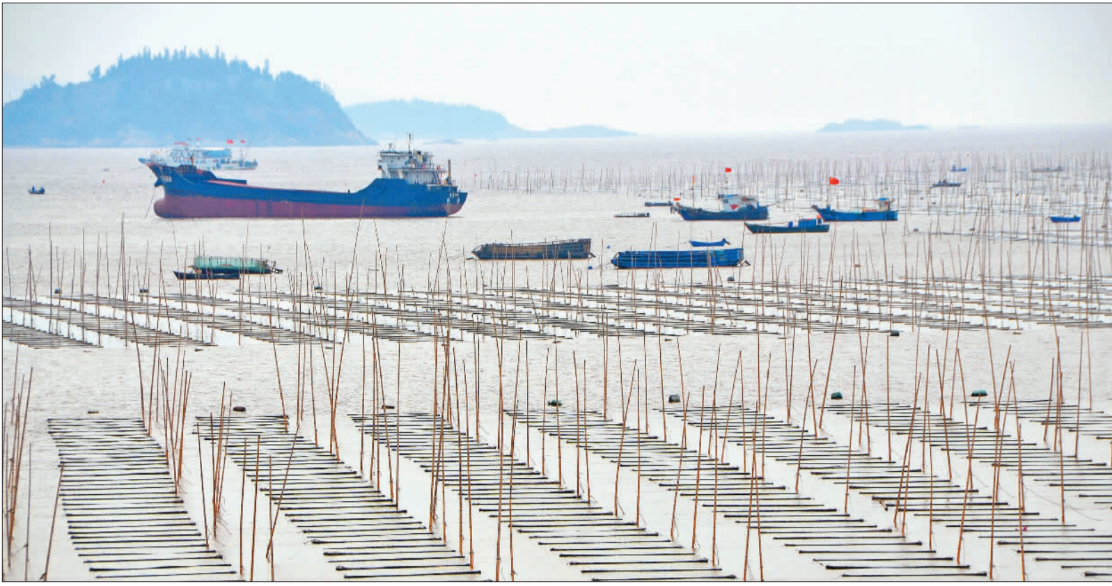
▲2月7日,浙江省玉环市干江镇“海上共富菜园”,渔民在采收紫菜。随着育苗、养殖技术不断提高,浅海滩涂紫菜养殖成为渔民增收致富的好途径。