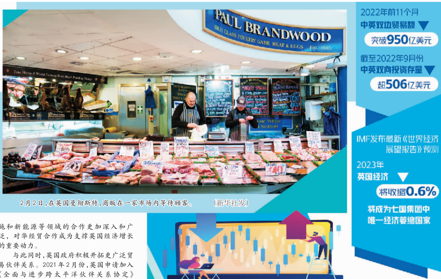
2月2日,在英国曼彻斯特,商贩在一家市场内等待顾客。

纵观英国“脱欧”后的经济发展历程,可谓一波三折。新冠疫情导致经济放缓、地缘政治引发供应链受阻、俄乌冲突导致通胀飙升,以及英国国内政治不稳等因素都加剧了英国的经济衰退。虽然“脱欧”公投后,英国随即确立了“全球英国”的发展战略,并取得一定进展,但重塑其全球贸易与投资版图的努力却远非坦途,英国经济仍面临艰难的重新建构。