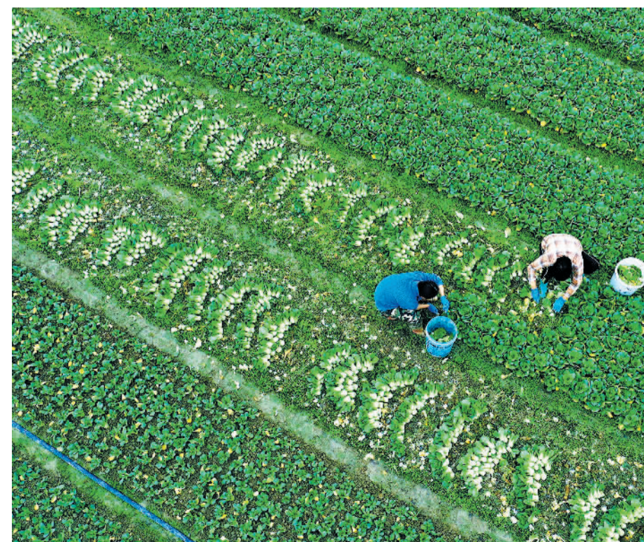
2月9日,广西梧州万秀区夏郢镇镇安村的种植基地,田园翠绿。近年来,当地采取“稻+菜”的模式,充分利用冬闲时间的部分稻田接茬种植无公害蔬菜,解决耕地冬闲问题,提高耕地利用率和产出率。

此前,生态环境部环境影响评价与排放管理司司长刘志全在月度例行新闻发布会上表示,在企业排污许可方面,生态环境部持续推动排污许可制改革,推进制度衔接流程优化,减轻企业负担。实现排污企业在许可平台统一填报、统一公开手工监测信息,避免重复填报。实行排污许可“一网通办”“跨省通办”“全程网办”,最大限度便利企业。