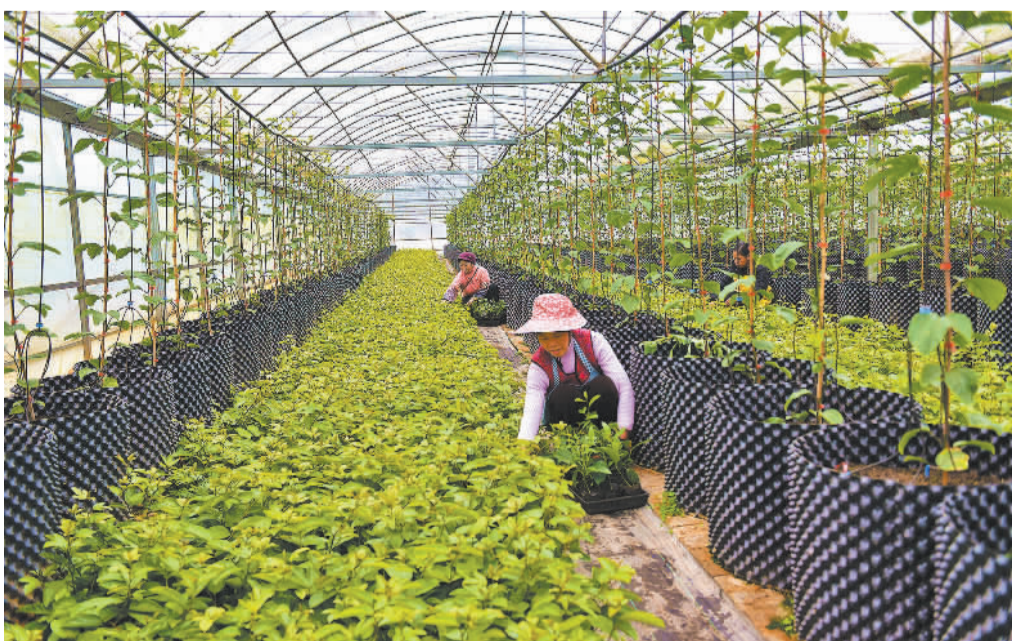
早春时节，村民在贵州省黔东南苗族侗族自治州从江县百香果产业示范园种苗繁育中心管护百香果秧苗。近年来，从江县立足区域农业生产特色，通过“订单育苗”的方式，带动蔬菜瓜果、中药材等秧苗专业化生产和经营，推动当地农业高质量发展。